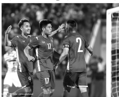
● Ảnh minh họa.

Phát biểu sau trận đấu lượt đi với U20 Hàn Quốc, HLV Park Hang Seo cảm thấy hài lòng khi thử nghiệm và đánh giá được nhiều cầu thủ dự bị, ít được thi đấu trong đội hình U23 Việt