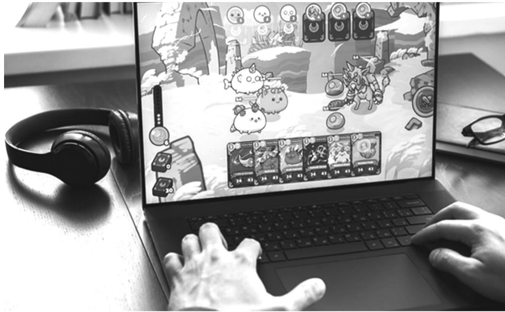
● Sky Mavis - một trong 2 “kỳ lân” mới của Việt Nam trong năm 2021.

Xét về tốc độ tăng trưởng theo năm, Việt Nam dẫn đầu về số lượng đầu tư và đứng thứ ba về giá trị