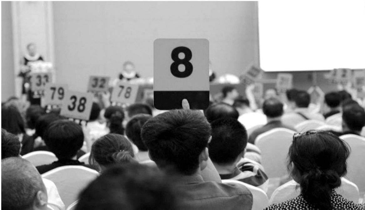
● Một phiên đấu giá tài sản. Ảnh minh họa

Đây là một trong những giải pháp quan trọng theo Bộ Tư pháp để tiếp tục nâng cao hiệu lực, hiệu quả của quản lý nhà nước đối với hoạt động đấu giá tài sản trong thời gian tới.