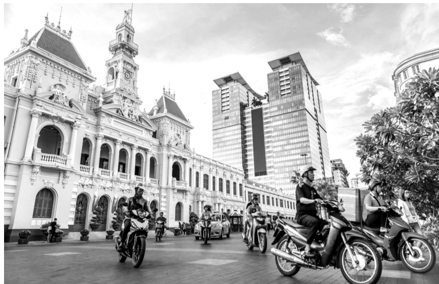
● Ảnh minh họa.

Ban Chỉ đạo phòng chống dịch và phục hồi kinh tế TP HCM vừa ban hành bộ tiêu chí đánh giá an toàn trong phòng chống dịch COVID-19 đối với các hoạt động, ngành nghề, lĩnh vực trong giai đoạn thích ứng an toàn, linh hoạt, kiểm soát hiệu quả dịch COVID-19 trên địa bàn TP HCM.