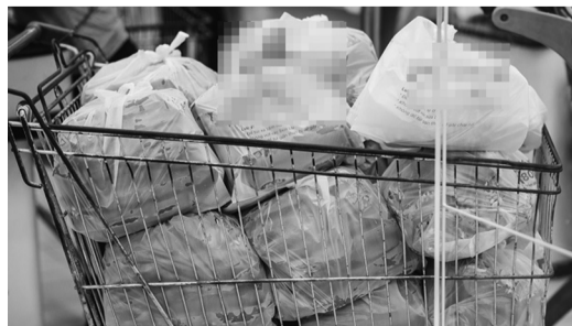
● Đề xuất từ năm 2026 sẽ xử phạt nhà bán lẻ cung cấp túi ni lông dùng 1 lần cho khách hàng. (Ảnh minh họa)

Ở mức độ mạnh hơn, Chính phủ Nam Phi cấm dùng túi ni lông siêu mỏng từ tháng 5/2003; do đó những nhà bán lẻ vi phạm có thể đối mặt với án phạt tới 100.000 rand (khoảng hơn 300 triệu đồng) hoặc 10 năm tù giam. Mặt khác, năm 2010, Gabon là nước đầu tiên trên thế giới cấm tất cả các loại túi ni lông trên toàn bộ phạm vi lãnh thổ. Còn tại Kenya, kể từ năm 2017, việc sản xuất, sử dụng túi ni lông là bất hợp pháp; bất cứ ai vi phạm sẽ phải đối mặt với mức án 4 năm tù và phạt 38.000 USD.