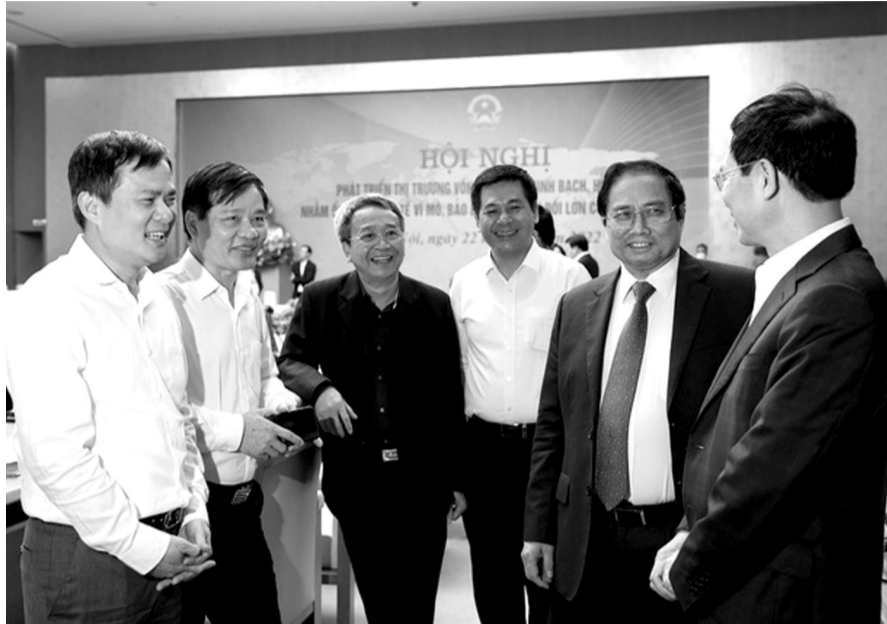
● Thủ tướng Phạm Minh Chính trao đổi với các đại biểu dự Hội nghị.

Các ý kiến tại Hội nghị đánh giá những năm qua, thị trường vốn của Việt Nam phát triển nhanh cả về chiều rộng và chiều sâu. Quy mô, sản phẩm, thanh khoản tăng nhanh, góp phần huy động được nguồn lực tài chính rất quan trọng cho nền kinh tế, hỗ trợ và bổ sung cho kênh cung ứng vốn truyền thống là tín dụng ngân hàng. Thị trường vốn đã hình thành và vận hành đầy đủ các cấu phần bao gồm: Thị trường cổ phiếu, thị trường trái phiếu, thị trường chứng khoán phái sinh. Bên cạnh những kết quả tích cực đã đạt được, thị trường vốn còn những hạn chế, bất cập, cá biệt còn một số tổ chức, cá nhân vi phạm quy định pháp luật khi tham gia thị trường. Tuy nhiên, những sai phạm chỉ là thiểu số. Việc xử lý là cần thiết, góp phần bảo vệ quyền và lợi ích hợp pháp cho đại đa số các nhà đầu tư, doanh nghiệp chân chính, hoạt động lành mạnh, tuân thủ pháp luật. Đây cũng là bước