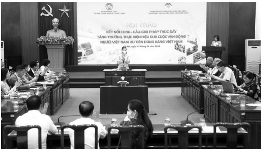
● Quang cảnh Hội thảo.