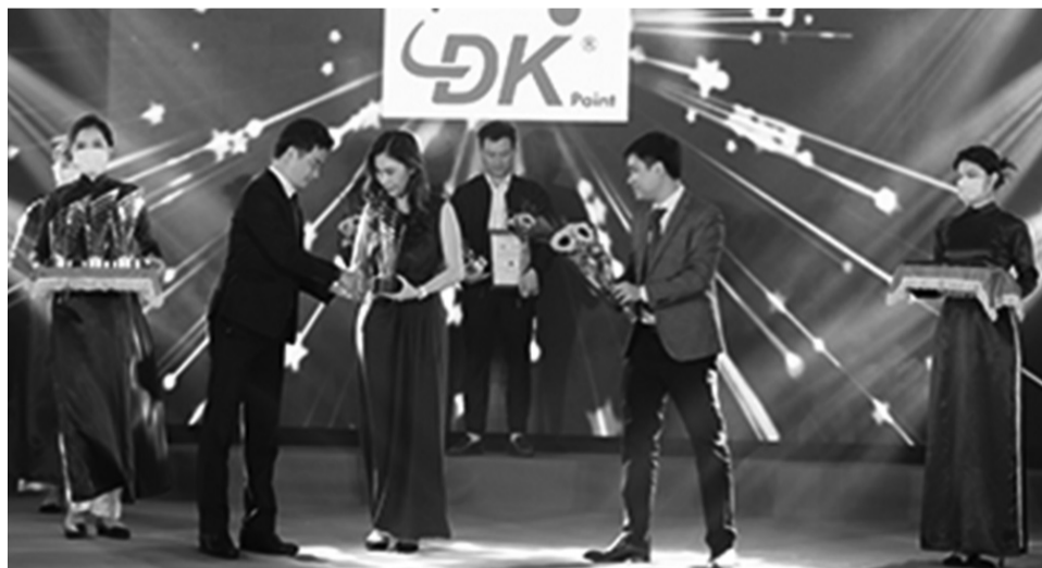
● Sơn ĐK nhận giải thưởng Top 20 thương hiệu tiêu biểu ngành xây dựng 2022.

“Tôi làm công tác xã hội không phải để “đánh bóng” thương hiệu mà chỉ đơn giản muốn giúp đỡ mọi người thoát khỏi khó khăn, hoạn nạn. Khi làm những việc đó, tôi cũng không mưu cầu sẽ nhận lại gì mà chỉ xuất phát từ trái tim mình, từ cảnh ngộ của bản thân mà muốn chia sẻ”, bà Trâm cho biết.