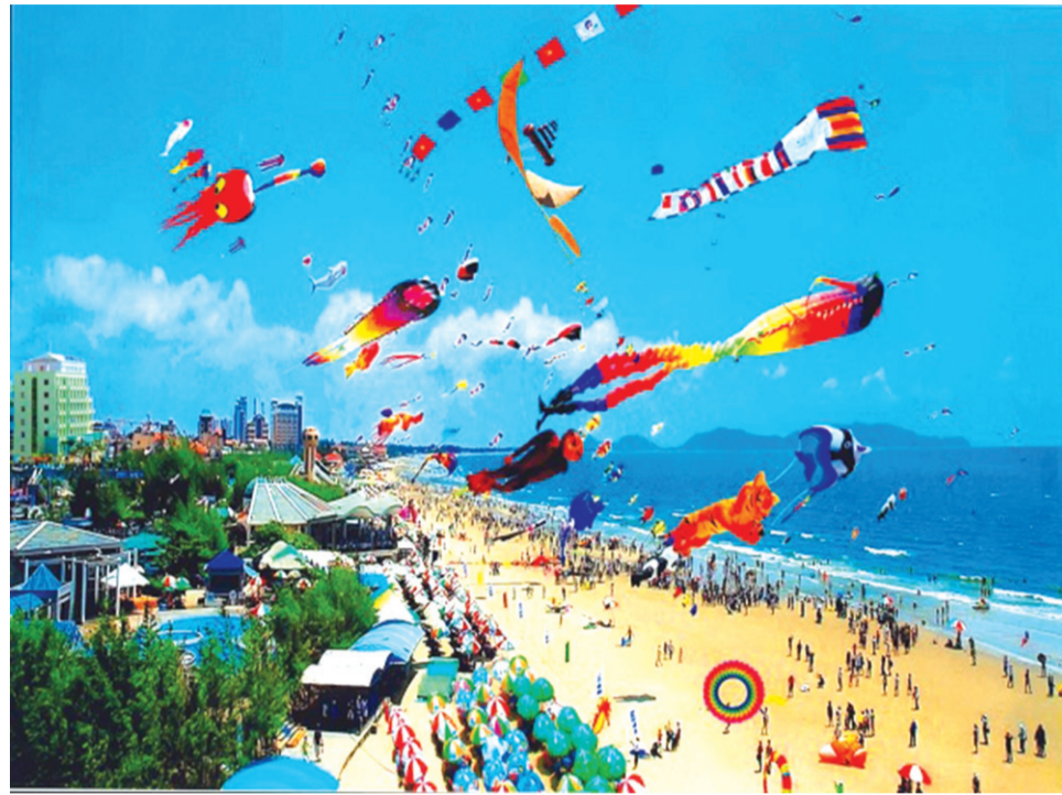
● Ngành du lịch cần đảm bảo an toàn, tránh tình trạng quá tải dịp nghỉ lễ. (Ảnh minh họa)

Còn với chương trình tour, đại diện Công ty Du lịch Vietrantour cho biết, tour có đường hàng không do các công ty du