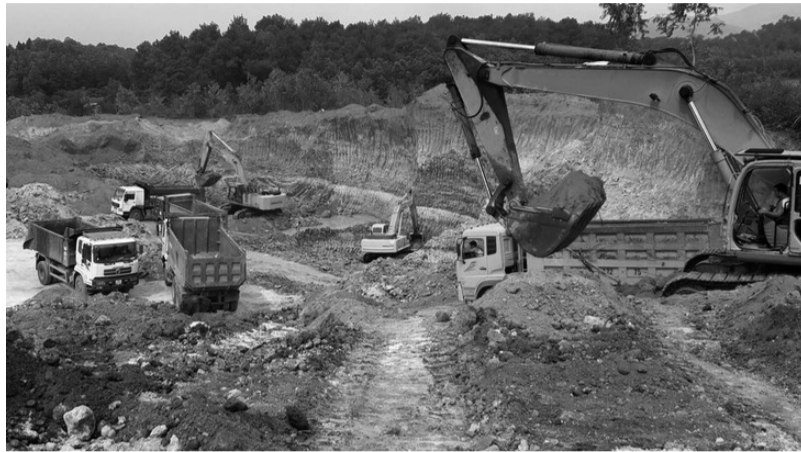
● Ảnh minh họa.

Chính phủ và Thủ tướng Chính phủ cũng đã ban hành nhiều văn bản nhằm tăng cường quản lý khai thác khoáng sản. Trong đó, khuyến khích sử dụng vật liệu khác thay thế cát, sỏi lòng sông. Tại Chỉ thị số 38/CT-TTg, Thủ tướng chỉ đạo: Bộ Tài chính rà soát tổng thể chính sách tài chính về khoáng sản (bao gồm chính sách phí) đề xuất điều chỉnh chính sách tài chính phù hợp với thực tế, thúc đẩy phát triển, khuyến khích sử dụng vật liệu khác thay thế cát, sỏi lòng sông. Do đó, cần triển khai chủ trương của Đảng