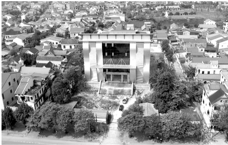
● Dự án xây dựng Trung tâm bảo tồn và phát huy di sản dân ca ví dặm Nghệ Tĩnh sau gần 7 năm chưa đưa vào sử dụng.

Riêng hạng mục bê chứa nước ngầm sắt thép do không được bảo quản đã gỉ sét gần như toàn bộ. Hệ thống cột đèn đã có hiện tượng bong tróc sơn phủ,