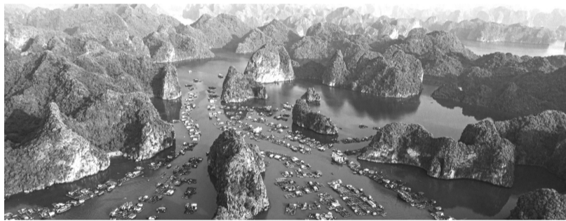
●Vùng biển đảo Cát Bà - Long Châu là một trong 4 vùng tự nhiên không gian biển Hải Phòng.

được hình thành, hoạt động một cách có hiệu quả. Trong đó, có thể kể đến là dự án phát triển văn hóa đọc “Ô cửa sách”.