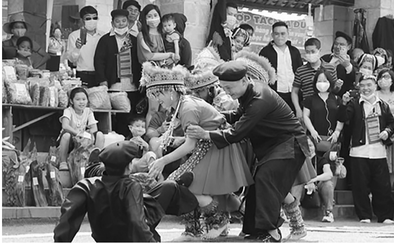
● Tái hiện tục “Kéo vợ” tại Làng Văn hóa du lịch các dân tộc Việt Nam.

Vấn đề trên được ông Nguyễn Đắc Vinh, Chủ nhiệm Ủy ban Văn hóa, Giáo dục của Quốc hội nhấn mạnh tại Toạ đàm “Thực hiện công tác tuyên truyền, vận động xây dựng nếp sống văn hóa, bài trừ biến tướng của tục “bắt vợ” ở một bộ phận đồng bào dân tộc thiểu số” diễn ra chiều 22/4.