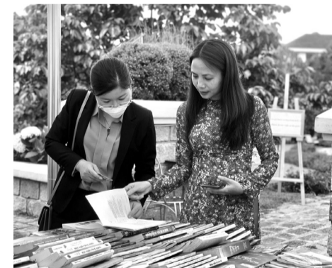
● Nhiều tài liệu quý được trưng bày ở không gian triển lãm sách.

Tại không gian triển lãm sách, tạp chí, báo,... diễn ra ở khách sạn Đà Lạt Palace nhiều đơn vị trên địa bàn đã tham gia hưởng ứng. Nhiều tư liệu quý về Đà Lạt, cũng như nhiều ấn phẩm sách do tác giả là người Đà Lạt viết. Bên cạnh đó nhiều sản