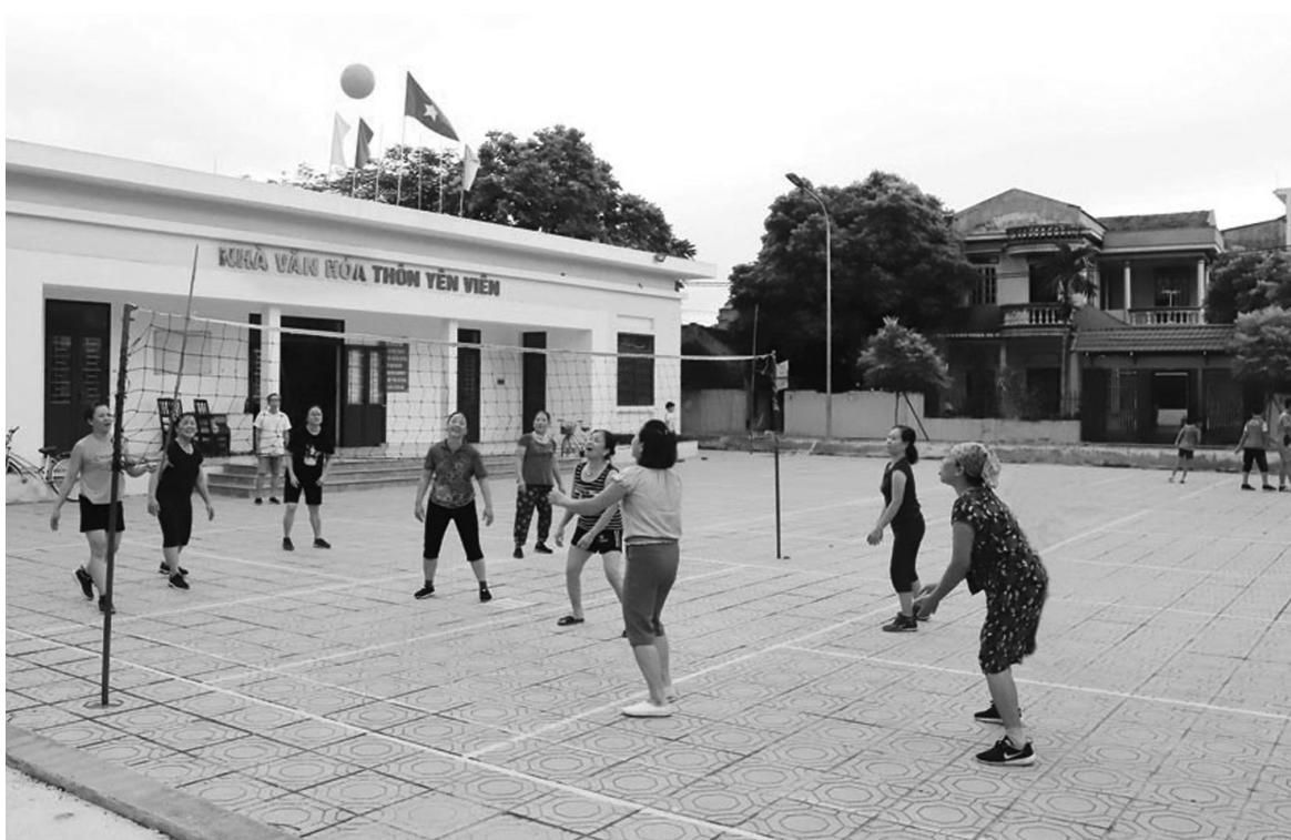
● Thời gian qua, việc xây dựng các thiết chế văn hoá luôn được Hà Nội quan tâm.

thiết chế chưa đạt chuẩn, xuống cấp, trang thiết bị chưa đồng bộ; một số dự án công viên, khu vui chơi giải trí, bảo tàng, trung tâm văn hóa còn chậm tiến độ.