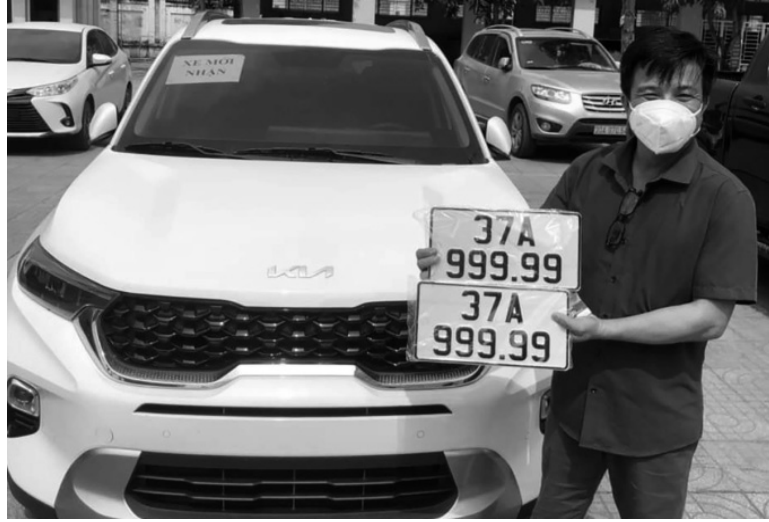
● Người đàn ông ở Nghệ An tự bấm được biển số ngũ quý.

mức lệ phí đăng ký cao nhất đang áp dụng tại địa phương.