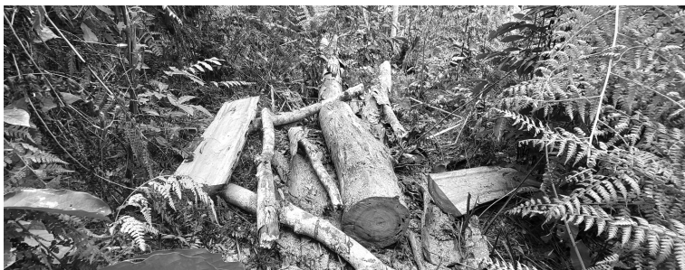
● Rừng lim xanh bị chặt hạ tại huyện Quỳnh Châu.

Theo báo cáo của Sở NN&PTNT Nghệ An, kể từ đầu 2022 đến trung tuần tháng 4/2022, toàn tỉnh đã phát hiện, xử lý 119 vụ vi phạm lâm luật. Trong đó, có gần 40 vụ phá rừng trái phép, gây thiệt hại 9,384ha rừng; tịch thu 51,413m 3 gỗ các loại và phạt tiền 400,2 triệu đồng. QUỲNH TRANG