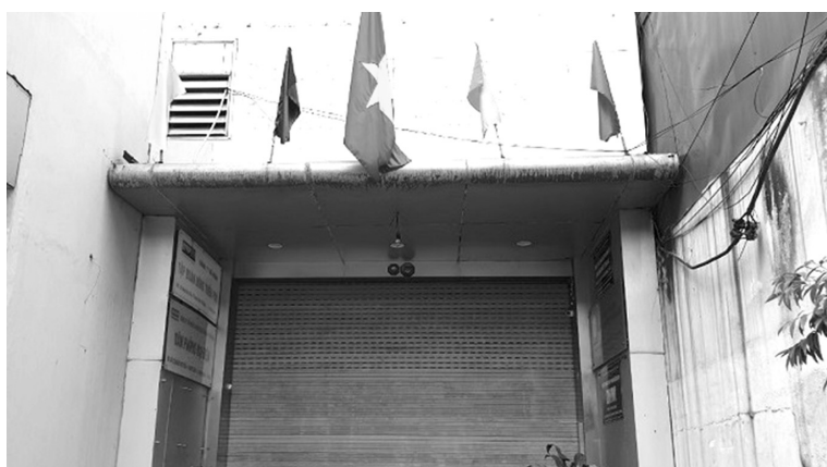
● Địa chỉ đăng ký hoạt động của Cty Đấu giá hợp danh Sao Vàng tại 122 Khuất Duy Tiến, quận Thanh Xuân, Hà Nội.

Công an TP Hà Nội vừa khởi tố vụ án “Lừa đảo chiếm đoạt tài sản” xảy ra tại Công ty Đấu giá hợp danh Sao Vàng, địa chỉ tại phường Nhân Chính, quận Thanh Xuân để làm rõ từ nội dung đơn thư của một số nạn nhân.