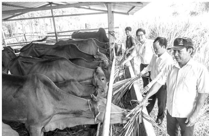
● Nhiều hộ dân trên địa bàn tỉnh Bình Dương vay vốn chính sách phát triển chăn nuôi bò.

Công cuộc giảm nghèo bền vững và bảo đảm an sinh xã hội trên địa bàn tỉnh Bình Dương đã đạt được những thành quả đáng ghi nhận. Thành quả đó có sự đóng góp thiết thực, quan trọng của hệ thống Chi nhánh Ngân hàng Chính sách xã hội tỉnh Bình Dương đã tập trung huy động nguồn lực, chuyển tài nhanh chóng, kịp thời nguồn vốn tín dụng ưu đãi của Nhà nước đến tận tay các đối tượng thụ hưởng.