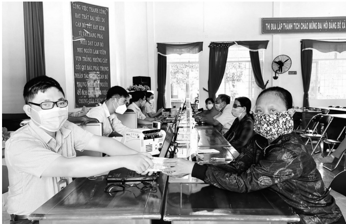
● Nguồn vốn ưu đãi được chuyển tài kịp thời đến người dân tại Điểm giao dịch xã.