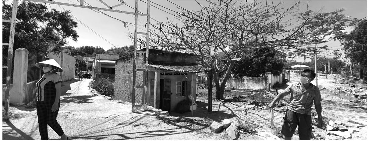
● 10 hộ dân sử dụng đất hơn 20 năm qua, nay bị thu hồi không bồi thường, không hỗ trợ.

Trước khi ra quyết định thu hồi đất của 10 hộ dân, UBND huyện Long Điền từng có văn bản đề nghị tỉnh cho chủ trương hỗ trợ 80% nhà ở, vật kiến trúc; vì cho rằng người dân sử dụng đất đã lâu, có hộ xây dựng nhà ở đến nay gần 23 năm và đã đăng ký hộ khẩu thường trú, nên việc Nhà nước thu hồi đất không bồi thường, hỗ trợ về đất, nhà ở, vật kiến trúc trên đất, các hộ gặp khó khăn. Thế nhưng, sau đó chính UBND huyện lại không dám động đến đề xuất này nữa.