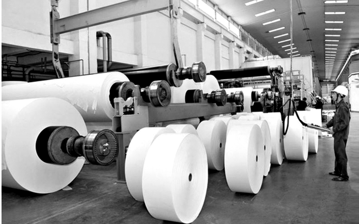
● Hướng dòng vốn vào sản xuất sẽ giúp kiểm soát lạm phát?

Xung đột Nga - Ukraine đang đẩy giá xăng dầu lên cao làm dấy lên mối lo lạm phát, trong đó có Việt Nam. Trong bối cảnh dự địa chính sách tiền tệ không còn nhiều, nhóm nghiên cứu Trường Đại học Kinh tế Quốc dân đề xuất cần hướng dòng tín dụng vào khu vực sản xuất và nền kinh tế thực nhằm kiểm soát lạm phát.