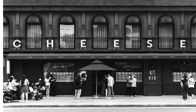
● Một quán cà phê “check in” thu hút nhiều bạn trẻ đến chụp ảnh.

“sống ảo” liên tục nở rộ tại TP HCM, xuất phát từ mong muốn được đến uống cà phê và chụp những bức ảnh đẹp đăng lên mạng xã hội, còn gọi là nhu cầu “check in” của các bạn trẻ.