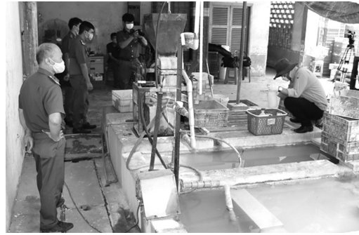
● Cảnh sát khám nghiệm khuôn viên xí nghiệp đèn ống, nơi chứa chất thải.

Lực lượng chức năng và xí nghiệp đèn ống thống nhất giao toàn bộ số chất thải trên cho một đơn vị xử lý chất thải nguy hại ở huyện Vĩnh Cửu thu gom. Lực lượng công an sẽ tiếp tục khai quật tại một số vị trí nghi vấn khác bên trong xí nghiệp để mở rộng điều tra.