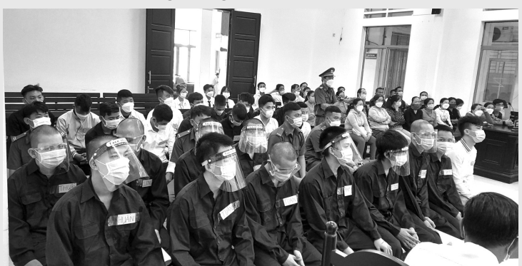
● Trong vụ án này, có tới 23 bị cáo bị tuyên phạt tù về tội Giết người.

Khoảng 20h30 ngày 15/3/2019, Tuấn tổ chức ăn nhậu tại địa tôm bỏ hoang thuộc tổ dân phố Phú Sơn, phường Cam Phú. Đến khoảng 20h cùng ngày, Kiệt và Tỉnh đi mua thêm đồ ăn. Khi đến khu vực cây xăng số 3 thuộc phường Cam Phú thì gặp nhóm Thuận cầm rựa, dao... Thấy Kiệt và Tỉnh, nhóm Thuận cầm hung khí rượt theo đuổi đánh nhưng không được.