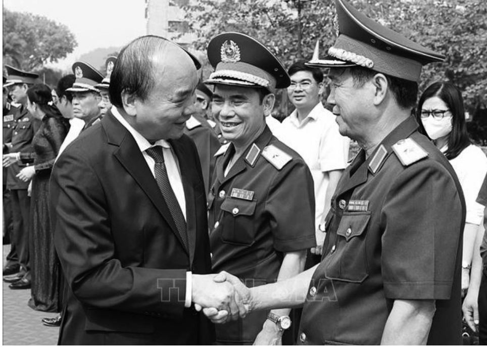
● Chủ tịch nước Nguyễn Xuân Phúc với lãnh đạo, sỹ quan chỉ huy Bộ Tư lệnh Quân khu 1.

Chủ tịch nước bày tỏ vui mừng được biết thời gian qua, trong bối cảnh tình hình thế giới và khu vực có những diễn biến phức tạp, Bộ Tư lệnh Quân khu 1 đã luôn quán triệt sâu sắc quan điểm đường lối của Đảng, Nhà nước; chủ động nắm, dự báo đúng tình hình, phối hợp chặt chẽ với các cấp ủy, chính quyền địa phương, thực hiện tốt các nhiệm vụ quân sự và quốc phòng trên địa bàn. Tập trung xây dựng, củng cố tiềm lực quốc phòng, thế trận chiến tranh nhân dân vững chắc, trọng tâm là xây dựng khu vực phòng thủ tỉnh, huyện ngày càng đi vào chiều sâu, phát huy tính hiệu quả