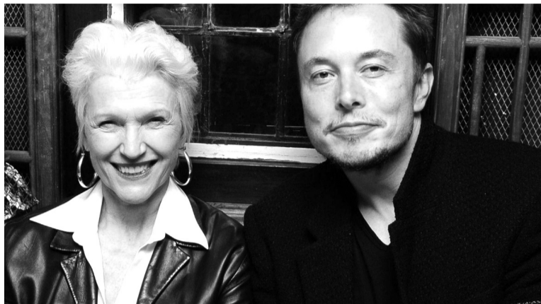
● Tỉ phú Elon Musk và mẹ.

Vị tỉ phú mô tả mẹ là “một người phụ nữ dịu dàng, lười biếng nhưng rất mạnh mẽ, quyết liệt”. Dù rất bận nhưng mẹ của ông luôn thu xếp được thời gian để chăm lo, quan tâm đến con cái. Ông tự nhận xét bản thân là một đứa trẻ nghịch ngợm nhưng mẹ ông đã luôn nói rằng “con không phải đứa trẻ xấu”. Bà ủng hộ và khuyến khích con biết phân định phải trái và làm những điều đúng đắn. Một lần, Kazuo bị một người họ hàng bắt nạt đến chảy máu, mẹ ông đã không ngần ngại xông thẳng