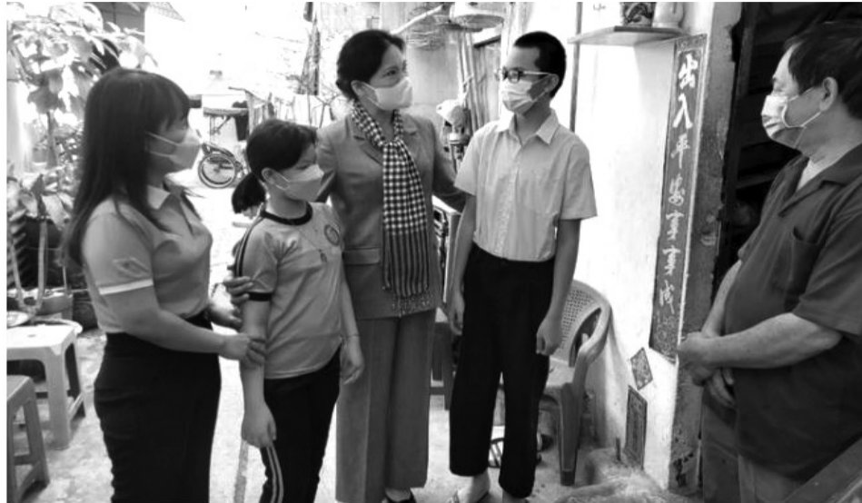
● Chủ tịch Hội LHPN Việt Nam Hà Thị Nga (thứ 3 từ trái qua) chia sẻ, động viên trẻ mồ côi do dịch Covid-19.

Hưởng ứng phong trào thi đua đặc biệt “Cả nước chung sức, đồng lòng thi đua phòng, chống và chiến thắng đại dịch COVID-19” do Thủ tướng Chính phủ phát động; Chương trình “Triệu phần quà san sẻ yêu thương” tập trung hỗ trợ an sinh xã hội cho phụ nữ, trẻ em bị ảnh hưởng bởi đại dịch COVID-19, ngày 20/10/2021, Đoàn Chủ tịch Trung ương Hội LHPN Việt Nam đã phát động và triển khai