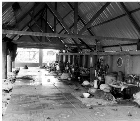
●Những vật dụng cá nhân người đã khuất được để lại trong nhà mồ.