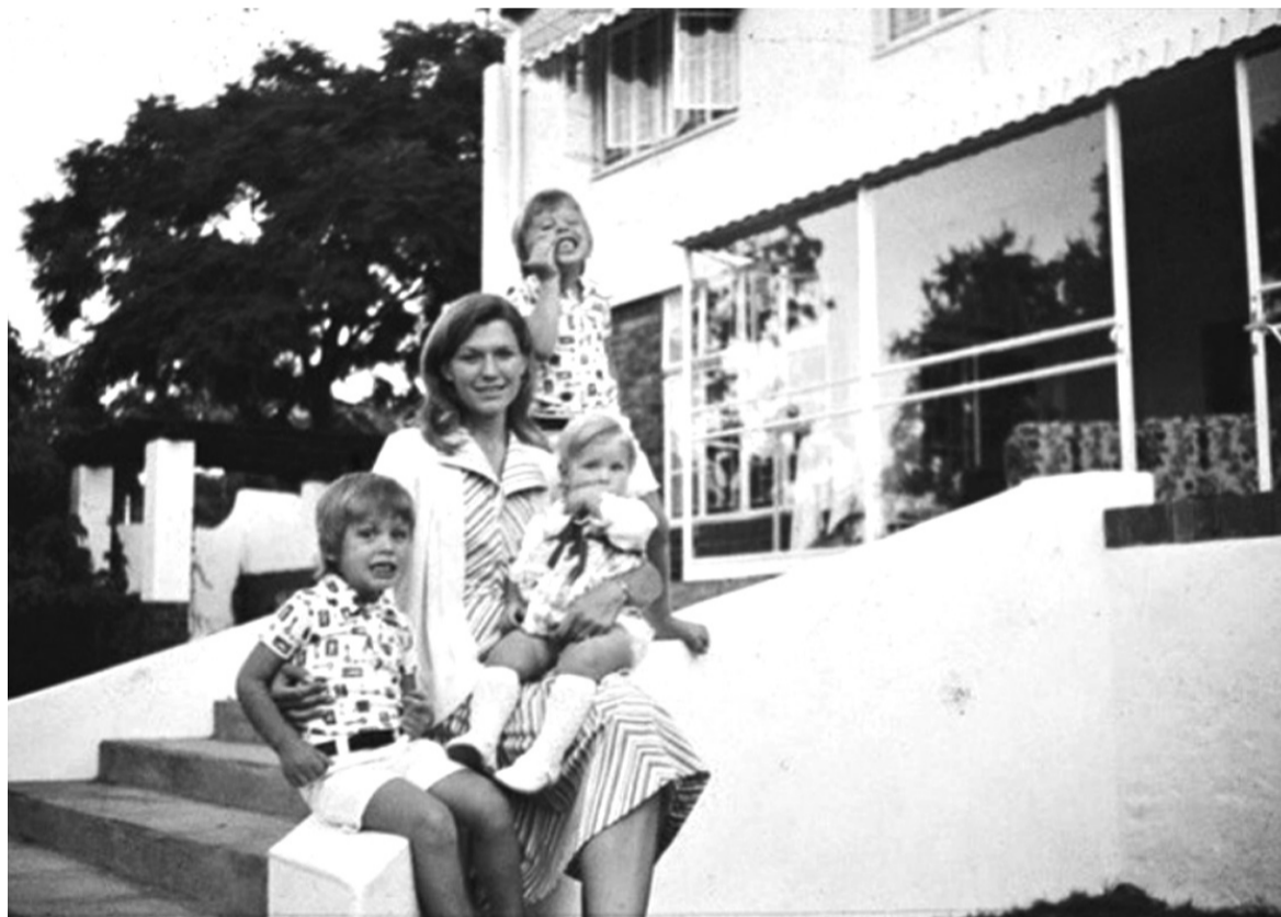
● Ở tuổi ngoài 30, bà Maye trở thành mẹ đơn thân của ba con nhỏ.

vào nhà người họ hàng kia để răn đe và bảo vệ con mình, trong khi bố cậu bé lúc bấy giờ lại “chùn chân” vì e ngại. Khi nhắc lại câu chuyện này, ông Kazuo nói rằng, mỗi lần gặp phải điều bất công trong cuộc sống, ông lại nhớ đến sự dũng cảm của mẹ mà không lùi bước.