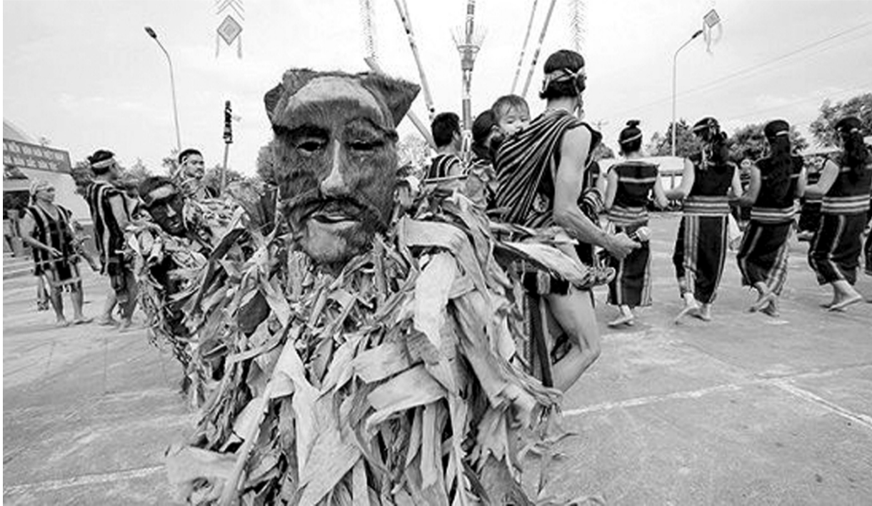
●Người dân Jrai tổ chức lễ bỏ mả độc đáo.

Đối với các dân tộc Tây Nguyên như Jrai, Ê Đê, Bahnar chết không phải là hết mà là sự tiếp tục cuộc sống khác để rồi sẽ trở lại làm người. Cho nên, nhà mồ và lễ bỏ mả của người Tây Nguyên là biểu tượng đề cao sự bất diệt của cuộc sống con người và là nét văn hóa độc đáo nơi đại ngàn.