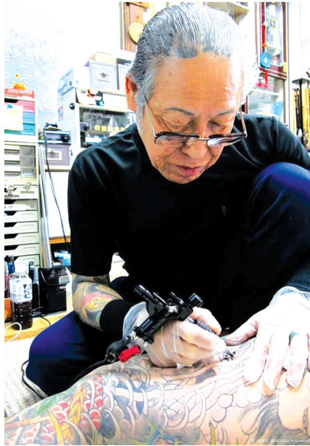
● Một nghệ nhân xăm hình ở Nhật Bản.

Không giống như nhiều nước trên thế giới, ở Nhật Bản xăm hình lâu nay luôn bị người dân kỳ thị, những ai có hình xăm trên người bị coi là liên kết với các băng đảng tội phạm như yakuza. Cũng chính vì vậy mà bất kỳ ai có hình xăm trên người, kể cả những người trong nghề, thường không thể tới các bể bơi công cộng, suối nước nóng, bãi biển, thậm chí là một số phòng tập thể dục.