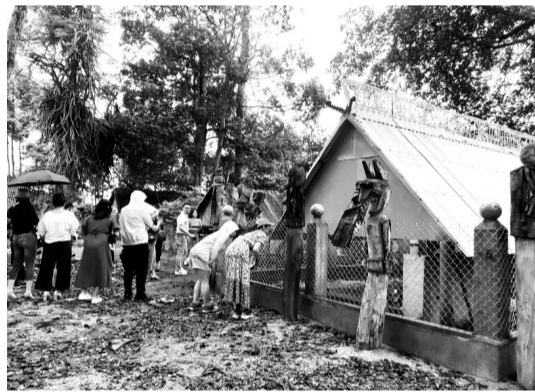
●Mái gỗ, mái tranh nhà mồ được thay thế bằng mái tôn.