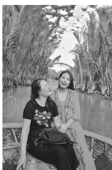
● Trân trọng những khoảnh khắc đáng giá, ý nghĩa nhất cùng mẹ.

Nội là mẹ anh thích nhất. “Mình nhớ lần đi Hà Nội, lần đầu tiên mẹ ngồi máy bay. Mẹ đã khóc, bảo với mình rằng không ngờ có ngày mẹ được đến thăm Thủ đô. Tự dung khoe mắt mình cay cay và nghẹn lòng khó nói. Lúc đó mình thầm nghĩ, câu nói của mẹ chính là động lực để mình cố gắng làm việc hơn, kiếm nhiều tiền đưa mẹ đi đây, đi đó”, Tài nhớ lại.