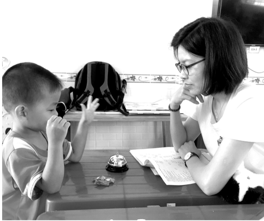
● Con được bình thường là mơ ước của biết bao người mẹ có con khuyết tật. (Ảnh minh họa)