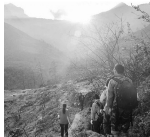
● Khi leo núi, du khách không được đi tách đoàn.

Sơn đang phát triển loại hình du lịch mạo hiểm, leo núi thể thao. Những năm gần đây, khu du lịch cộng đồng Hữu Liên, Yên Thịnh của huyện Hữu Lũng, Lạng Sơn trở thành một trong những điểm đến hấp dẫn du khách. Sản phẩm leo núi thể thao mạo hiểm mới được địa phương đưa vào triển khai đã tạo ra điểm nhấn thu hút đông đảo du khách đến với vùng đất này.