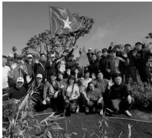
● Chinh phục đỉnh núi Pu Ta Leng cao hơn 3.000m đang là tour du lịch được giới trẻ ưa thích.