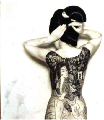
● Nghệ thuật xăm hình của Nhật Bản.