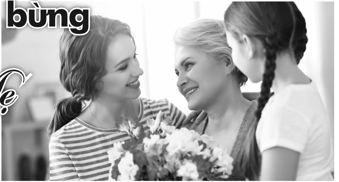
● Trong Ngày của Mẹ trên thế giới, con cái thường tặng hoa, quà và thiệp chúc mừng.

Có hơn 50 quốc gia trên thế giới chào đón Ngày của mẹ, nhưng mỗi quốc gia lại phát triển truyền thống kỷ niệm ngày này theo những cách riêng.