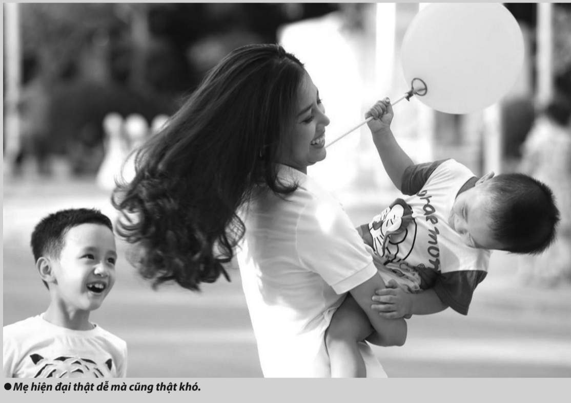
● Mẹ hiện đại thật dễ mà cũng thật khó.

chí còn là nguồn “cảm hứng” cho họ nỗ lực, phấn đấu hết mình.