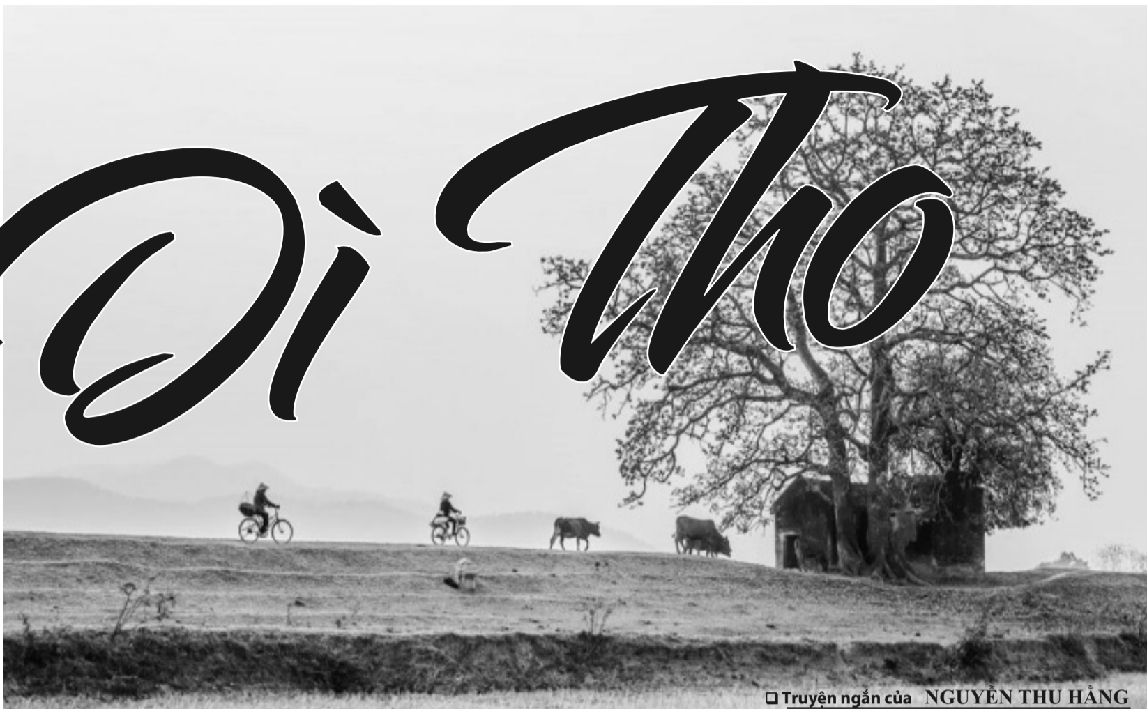
□ Truyện ngắn của NGUYỄN THU HẰNG

vũ khí của giặc qua sông bị du kích đánh đắm, vũ khí hư hỏng nặng, bị chìm, bị cướp mất, tám thằng lính Tây thiệt mạng, xác nổi lên phềnh trên sông. Bọn lính trong đồn sợ không dám tới gần, phải thuê mấy người dân chuyên chài lưới vớt xác đồng bọn lên.