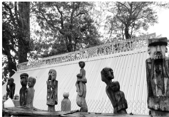
●Những bức tượng gỗ độc đáo được đặt xung quanh nhà mồ ở Gia Lai.