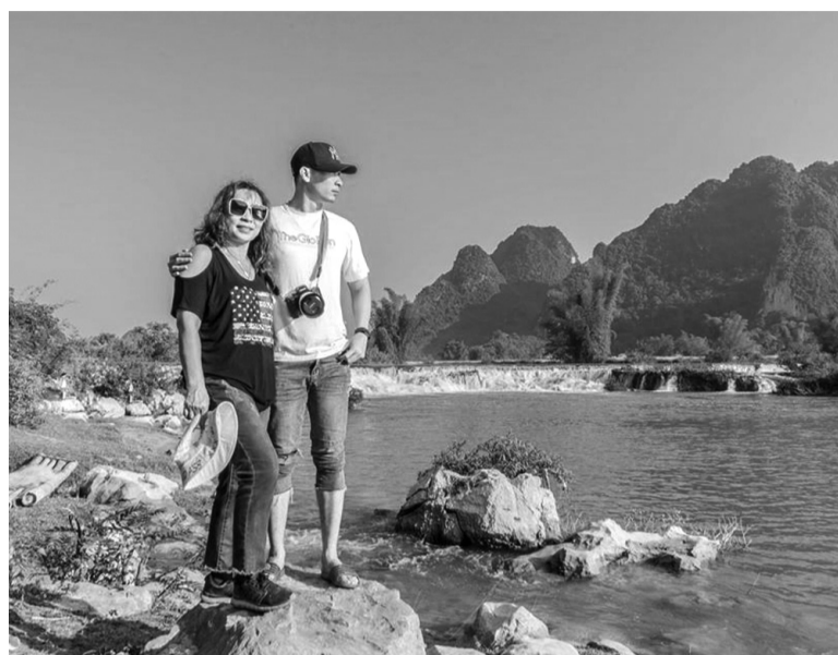
● Mỗi chuyến đi du lịch cùng mẹ là một kỷ niệm khó quên.

Mỗi chuyến đi đều mang đến những cảm xúc khác nhau nhưng Tài bảo, lần ra thăm Hà