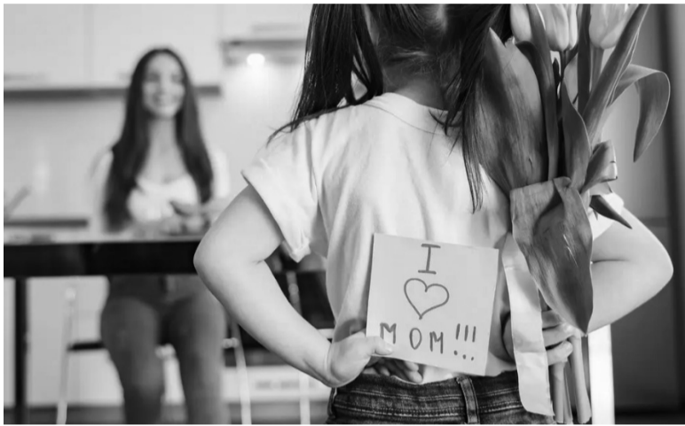
● Điều ý nghĩa nhất đối với các bà mẹ trên thế giới là tấm lòng của con cái.