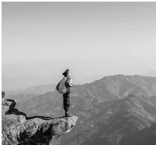
● Du khách cần cẩn trọng khi chinh phục các đỉnh núi.