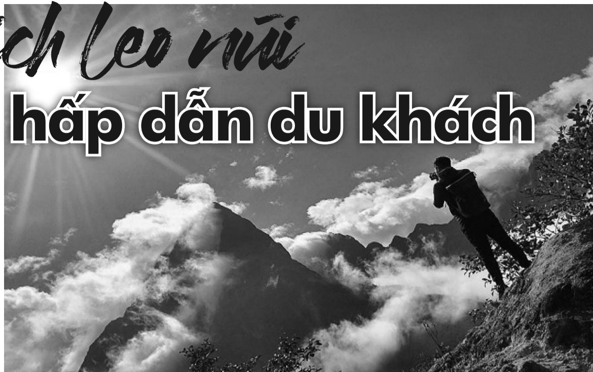
● Chinh phục các đỉnh núi đang hấp dẫn du khách.

Được thiên nhiên ban tặng những dãy núi trải dài tạo nên cảnh quan kỳ vĩ, ngành du lịch các tỉnh miền núi phía Bắc đang tập trung phát triển, các loại hình du lịch, đặc biệt là du lịch leo núi để thu hút du khách trong và ngoài nước.