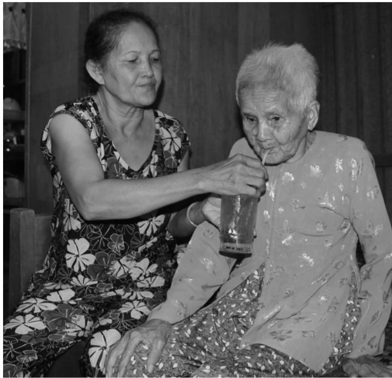
● Chăm sóc sức khỏe mẹ khi về già.

Ở tuổi già, mẹ thường có tâm lý tủi thân, rất cần sự thấu hiểu, chăm sóc của các con. Bởi vậy, những bữa ăn gia đình hay chuyến du lịch cùng mẹ là món quà tinh thần lớn lao dành cho mẹ.