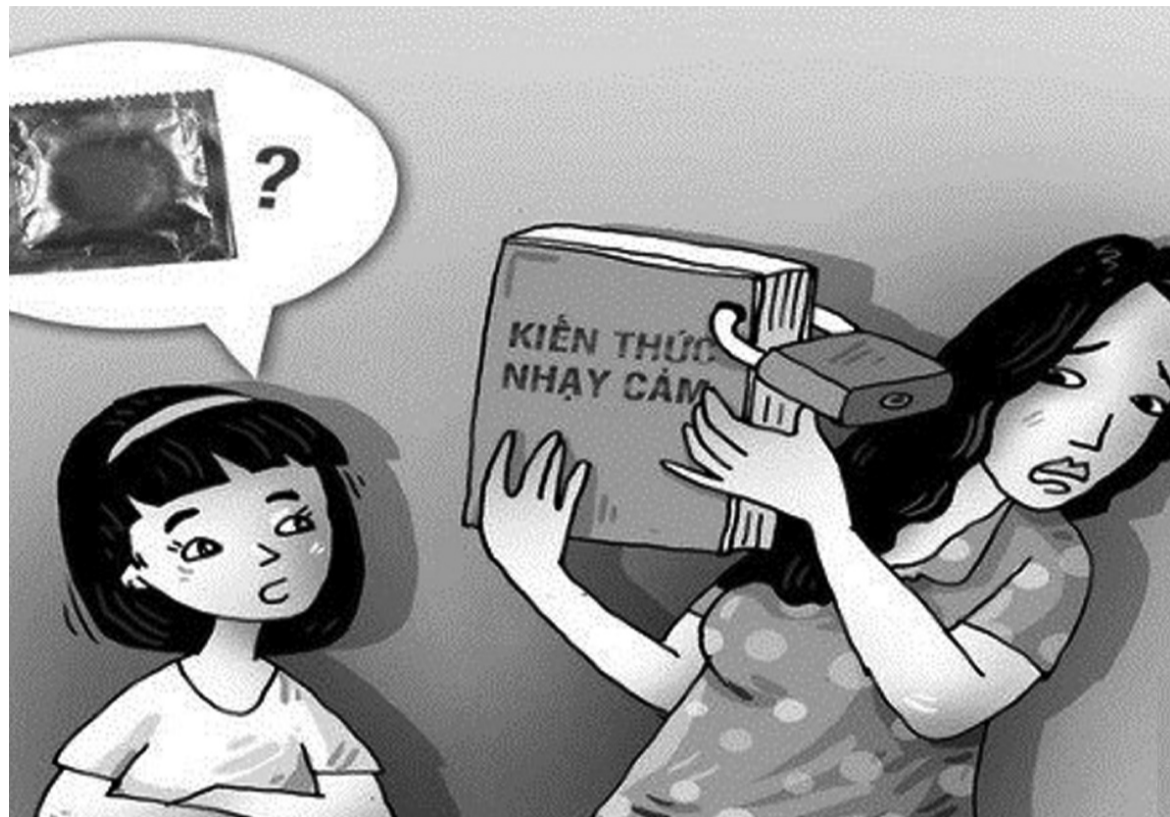
● Khi giáo dục giới tính luôn được xem là nhạy cảm. (Ảnh minh họa)