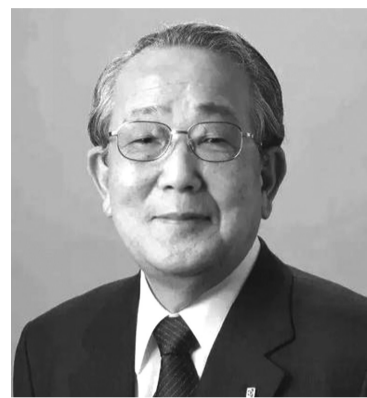
● Tỉ phú người Nhật Inamori Kazuo kể về mẹ là người “bất thường” và “lười biếng” nhưng ông lại trưởng thành từ đó.