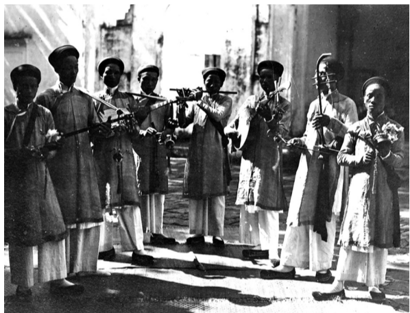
● Một số ảnh trong bộ ảnh.