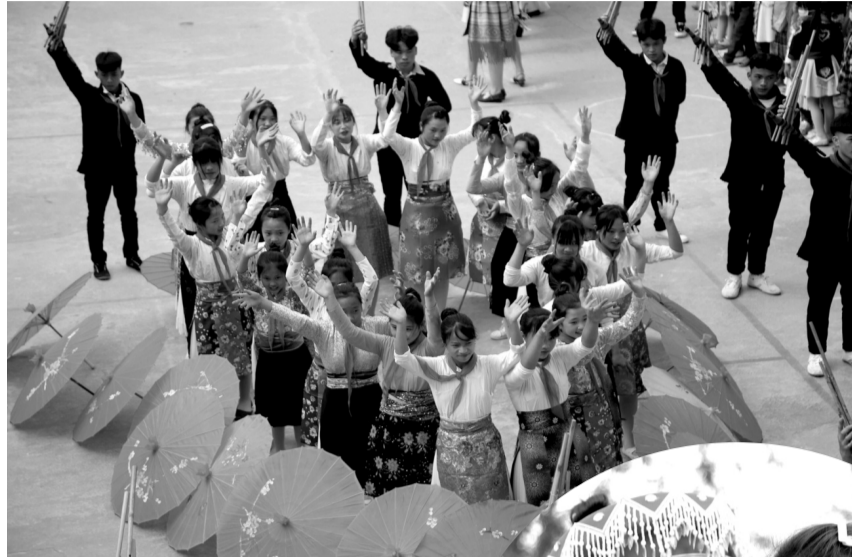
● Trường Tiểu học xã Cán Chu Phìn, huyện Mèo Vạc, một trong những trường tiêu biểu với hàng trăm học sinh là con em các dân tộc như: Mông, Pu Péo, Pà Thèn, Lô Lô, Cờ Lao, Giáy, Dao.