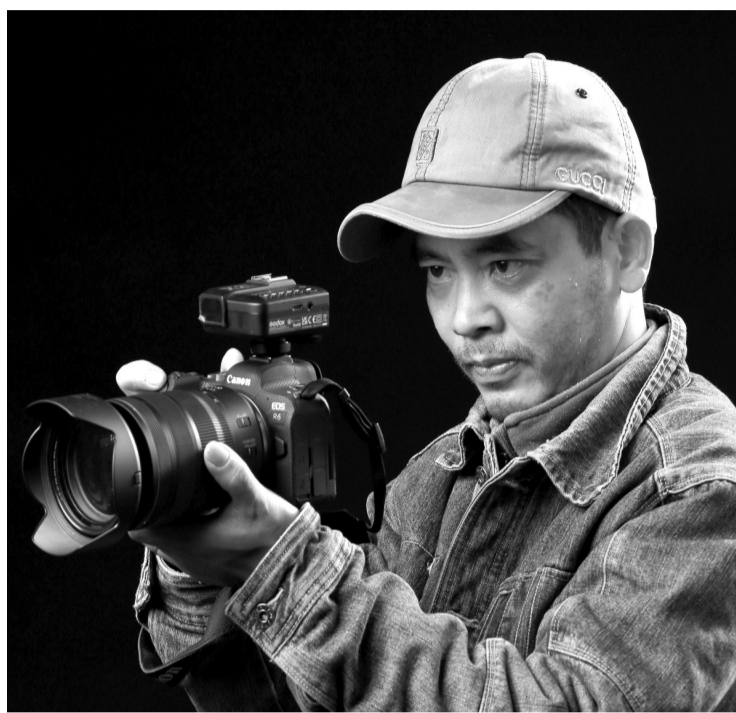
● Nhiếp ảnh gia Đoàn Bắc.