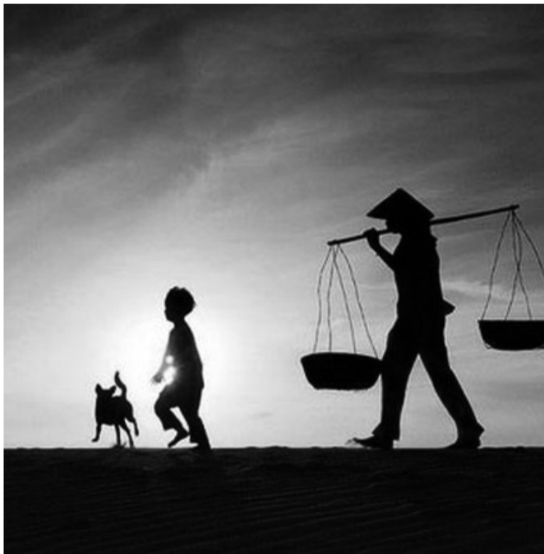
● Tiếng “Mẹ” chỉ gọi thôi, cũng chạm tới trái tim! (Ảnh minh họa)