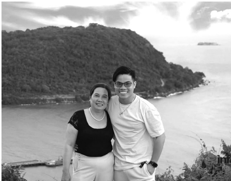
● Mẹ trở thành người đồng hành đặc biệt.