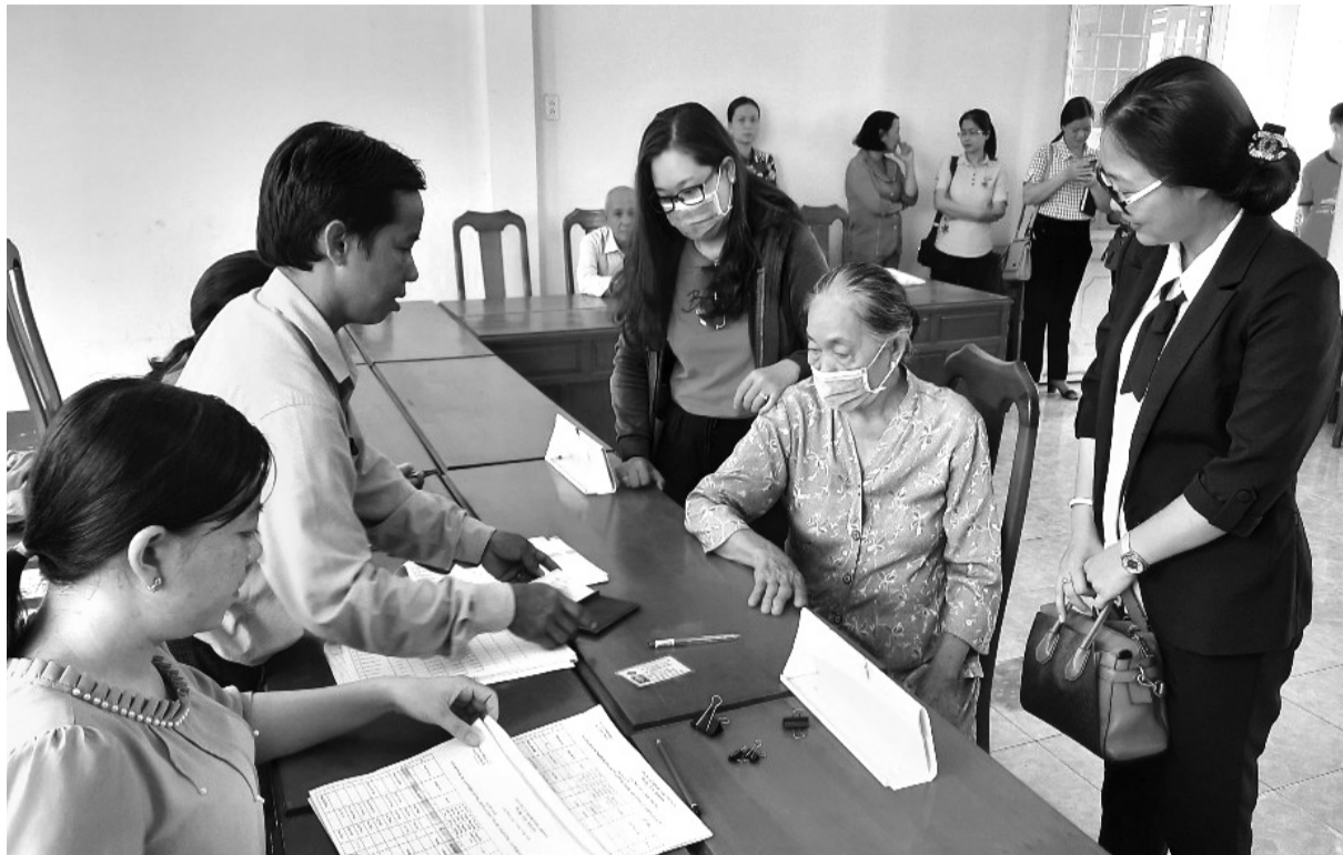
● Ảnh minh họa.

Bộ Tư pháp đang xây dựng dự thảo Quyết định của Thủ tướng Chính phủ phê duyệt Đề án tăng cường năng lực tiếp cận pháp luật của người dân giai đoạn 2022 – 2030. Theo đó, sẽ thiết lập các cơ chế hỗ trợ người dân nâng cao năng lực tiếp cận pháp luật.