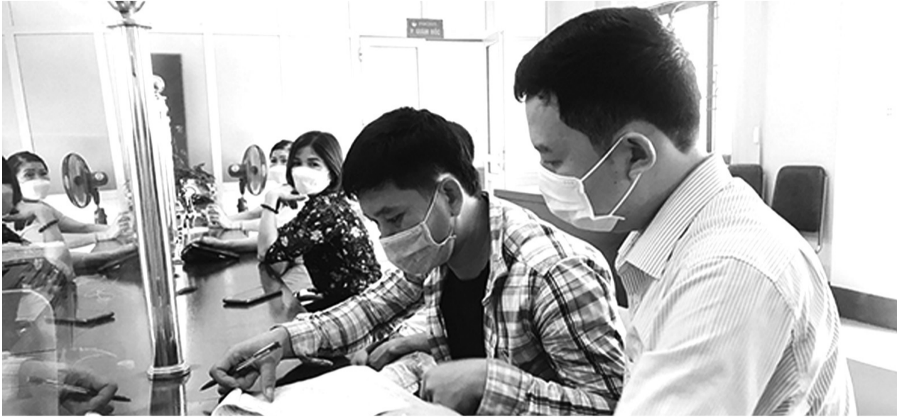
● Cán bộ Phòng giao dịch NHCSXH huyện Tân Kỳ hướng dẫn người dân làm thủ tục giải ngân vốn vay giải quyết việc làm.

Nghị quyết 11/NQ-CP về chương trình phục hồi phát triển kinh tế - xã hội được xem là chủ trương lớn của Đảng và Nhà nước ta. Để Nghị quyết đi vào cuộc sống, tỉnh Nghệ An đang khẩn trương chỉ đạo nhiều địa phương triển khai giải ngân cho vay các chương trình tín dụng.