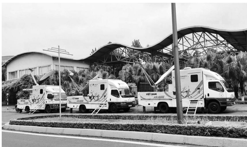
● VNPT điều động 3 xe chuyên dụng phát hình vệ tinh phục vụ cho công tác truyền dẫn tín hiệu truyền hình qua vệ tinh cho các hãng thông tấn trong khu vực.

Tại các địa điểm tổ chức và thi đấu kể trên, VNPT cũng đã tăng cường bố trí các chuyên gia kỹ thuật túc trực 24/7 để kịp thời xử lý các tình huống có thể phát sinh đối với hệ thống mạng trước, trong và cả sau Đại hội. CAO HÙNG