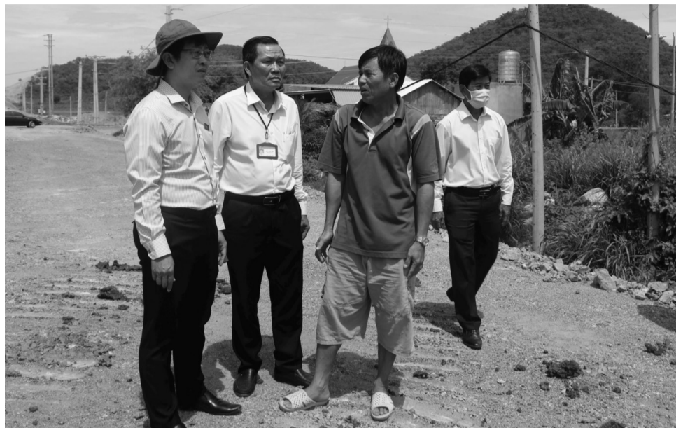
● Đại biểu Quốc hội tỉnh Bình Thuận thị sát tại điểm thi công công trình đường cao tốc

Chuẩn bị cho Kỳ họp thứ 3, Quốc hội khóa XV, nhiệm kỳ 2021 - 2026, các đại