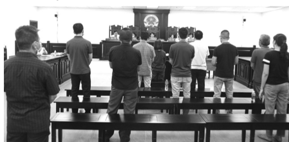
● Các bị cáo tại phiên tòa.

Các bị cáo đã tạo niềm tin và chiếm đoạt của PVI, PVFI và Ngân hàng Thương mại Cổ phần Habubank Hà Nội với tổng số tiền gần 300 tỉ đồng.