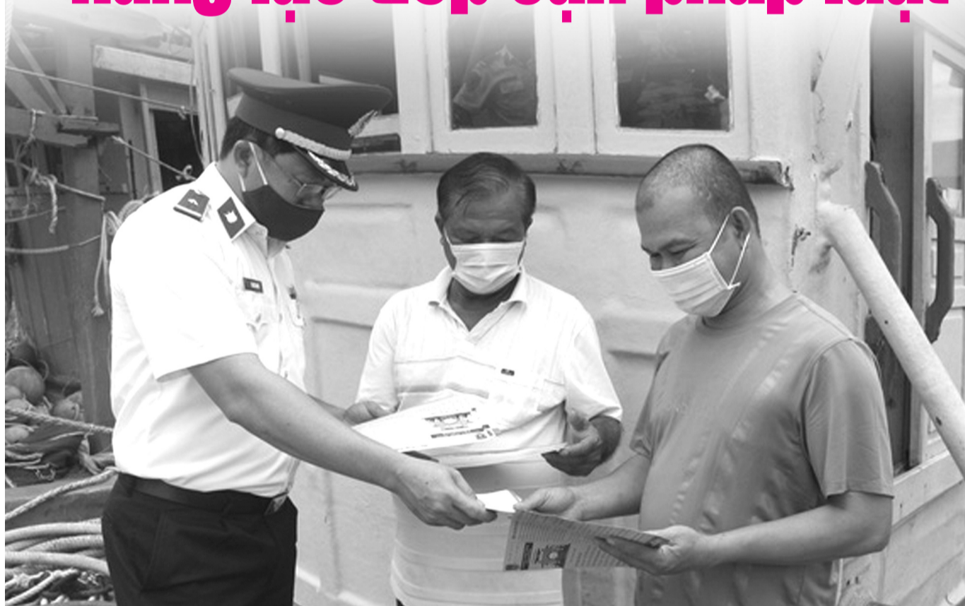
● Cảnh sát biển tuyên truyền về biển, đảo và phổ biến pháp luật cho ngư dân

Bộ Tư pháp đang xây dựng dự thảo Quyết định của Thủ tướng Chính phủ phê duyệt Đề án tăng cường năng lực tiếp cận pháp luật của người dân giai đoạn 2022 – 2030. Theo đó, sẽ thiết lập các cơ chế hỗ trợ người dân nâng cao năng lực tiếp cận pháp luật. (Trang 5)