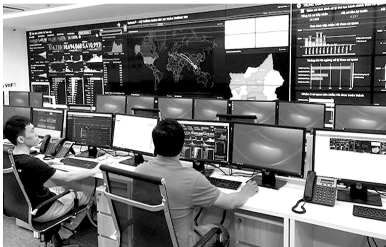
● Đảm bảo an toàn an ninh mạng là nhiệm vụ quan trọng góp phần bảo vệ Tổ quốc trong tình hình mới.

Thời gian qua, Đảng và Nhà nước ta đã rất quan tâm ban hành nhiều chủ trương, chính sách và biện pháp nhằm bảo đảm an toàn, an ninh thông tin, góp phần quan trọng bảo vệ chủ quyền quốc gia trên không gian mạng. Hiện Việt Nam đang thúc đẩy hình thành hệ sinh thái sản phẩm công nghệ thông tin và an toàn thông tin mạng “Made in Viet Nam”. Đây là nỗ lực của Việt Nam trong việc làm chủ công nghệ và kiểm soát chuỗi cung ứng về công nghệ thông tin và an toàn thông tin mạng, hướng tới một môi trường mạng tin cậy hơn. Cùng với đó là việc thành lập và phát triển các cơ quan chuyên trách bảo đảm an ninh thông tin, an ninh không gian mạng Quốc gia trực thuộc Bộ Công an, Bộ Quốc phòng, Bộ Thông tin và Truyền thông đủ