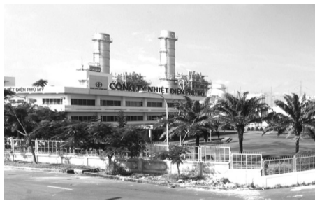
● Nhiệt điện BOT Phú Mỹ.

Trong văn bản, Bộ Công Thương cho rằng Bộ không có thẩm quyền giao một cơ quan, đơn vị tiếp nhận công trình, hệ thống cơ sở hạ tầng để vận hành kinh doanh và bảo trì. Do đó, nếu tiến hành giao 2 nhà máy điện BOT này cho EVN