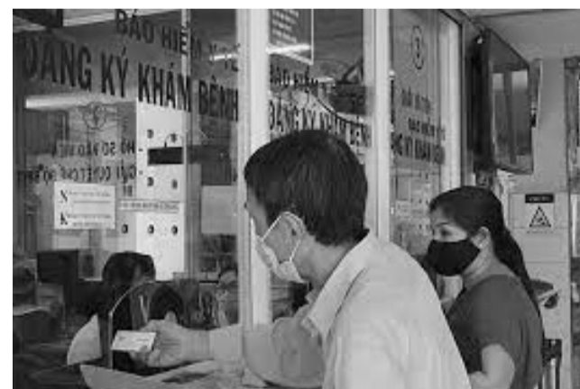
● Ảnh minh họa.

Đợt giám sát nhằm đánh giá việc triển khai thực hiện các quy định của pháp luật về BHXH, những kết quả đạt được, hạn chế, khó khăn cần tháo gỡ. Qua đó, đề xuất các giải pháp, kiến nghị với cấp có thẩm quyền các nội dung cần quan tâm để thực hiện có hiệu quả quy định của pháp luật về BHXH trên địa bàn TP Hà Nội. Dự kiến, vào cuối tháng 5 và đầu tháng 6/2022, Ban Văn hóa - Xã hội