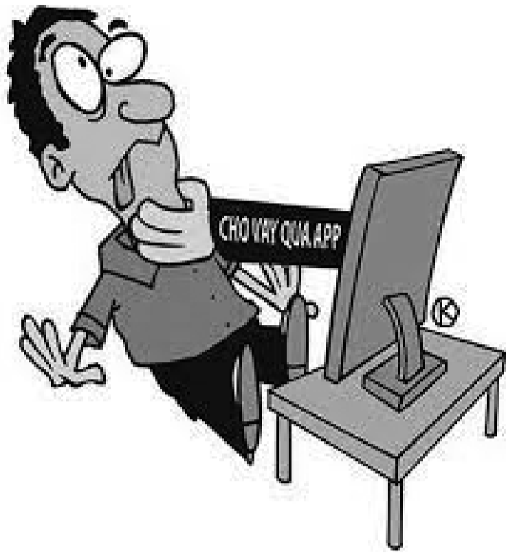
● Ảnh minh họa.

Đây là một hình thức đòi nợ qua mạng khá quen thuộc của những nhóm cho vay nặng lãi thông qua Zalo hoặc qua app đang phổ biến gần đây. Đầu tiên, nhóm cho vay tiếp cận “con mồi” bằng cách gửi tin nhắn quảng cáo vay tiền qua tin nhắn Zalo, Facebook, để lại đường link app hoặc số điện thoại với những thông tin mời gọi hấp dẫn như “vay ngay không thể chấp”, “hỏi vay nhận