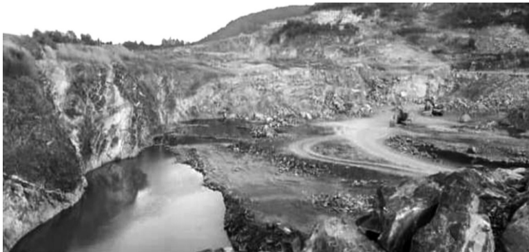
● Mỏ đá xây dựng lô 14A núi Thị Vải