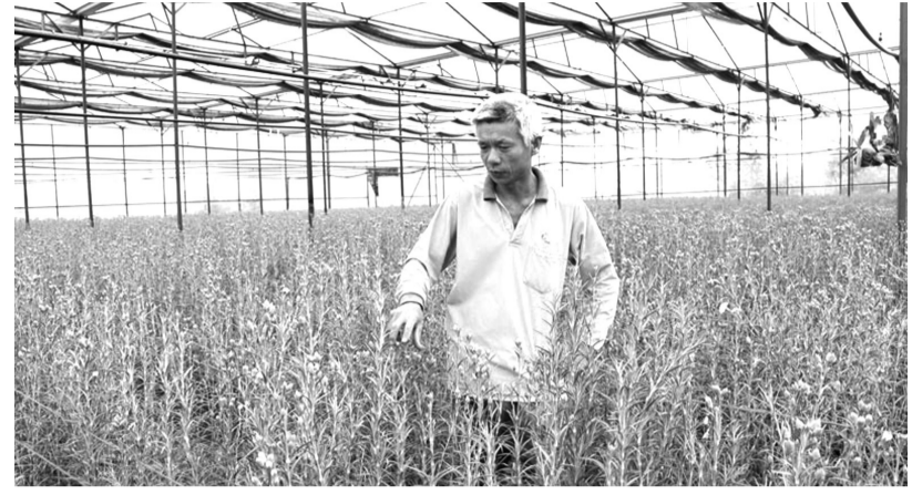
● Mô hình trồng hoa nhà kính của CCB ở huyện Lạc Dương, Lâm Đồng.

Không những anh dũng trong chiến đấu, bảo vệ Tổ quốc, các thành viên Hội Cựu chiến binh Lâm Đồng còn không ngừng nỗ lực xây dựng kinh tế, cải thiện đời sống, thông qua những chính sách, những chủ trương của Hội để giúp đỡ nhau sản xuất kinh tế, cải thiện đời sống, xứng đáng là Người lính Cụ Hồ.