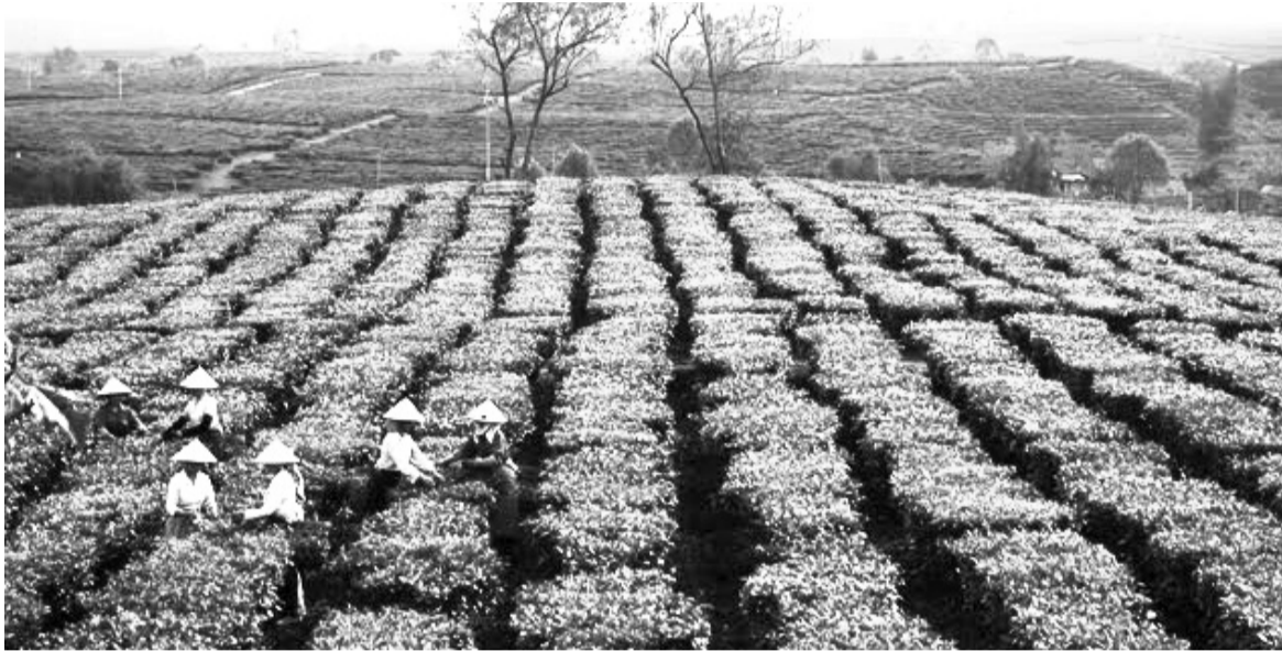
● Ảnh minh họa.

Nhưng theo các hộ dân thì kể từ khi ký hợp đồng, Công ty CP Chè Lâm Đồng đã không thực hiện bất kỳ một nghĩa vụ nào của mình về việc hướng dẫn kỹ thuật, chuyển giao công nghệ, khuyến nông trừ sâu bệnh... Do vậy, diện tích vườn chè bị chết ngày càng nhiều. Bà con đã nhiều lần làm đơn xin công ty cho phép trồng xen