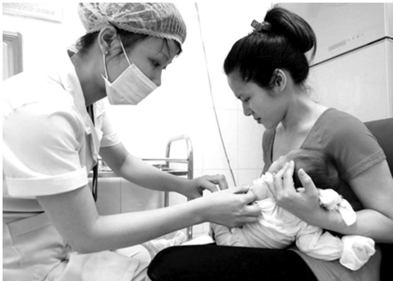
●Cần tăng cường triển khai bao phủ vaccine viêm gan B cho trẻ.

Thực hiện tốt việc khám, sàng lọc phát hiện sớm các trường hợp nhiễm virus viêm gan để điều trị, quản lý kịp thời hạn chế biến chứng. Chỉ đạo, hướng dẫn các đơn vị y tế trên