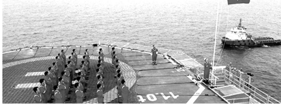
● Lao động PVEP trên giàn khoan giữa biển khơi.

“Thương hiệu PVEP đã trở thành thương hiệu uy tín trong hội nhập quốc tế và càng khẳng định vị thế của mình khi lần đầu tiên lãnh đạo Tổng Công ty đảm nhận vị trí Tổng Thư ký Hội đồng Dầu khí các