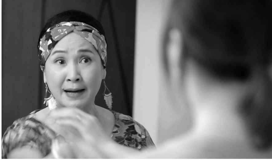
● Mối quan hệ mẹ chồng - nàng dâu gây ức chế trong phim “Thương ngày nắng về 2”

Mẹ chồng đã thế, chị chồng cũng nanh nọc, tai ác không kém khi liên tục hùa với mẹ bắt nạt, chèn ép em dâu và bày ra những trò mưu mô “bẫy” em dâu