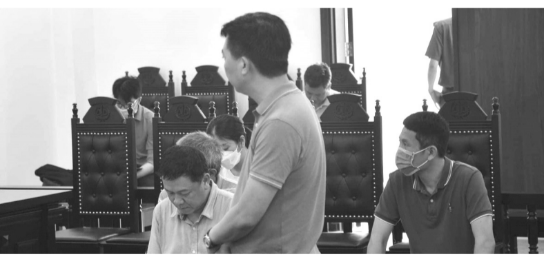
● Các bị cáo tại tòa.

Trong phần xét hỏi tại phiên tòa đã phát sinh một số tình tiết mới, xét thấy không thể làm rõ ngay được tại phiên tòa, sau hai ngày xét xử, Hội đồng xét xử đã quyết định trả hồ sơ để điều tra bổ sung, làm rõ việc các bị cáo tại SMES có chiếm đoạt tiền của PVI và PVFI hay không? Nếu có chiếm đoạt thì số tiền chiếm đoạt là bao nhiêu và chiếm đoạt theo phương thức nào? HỒNG MÂY