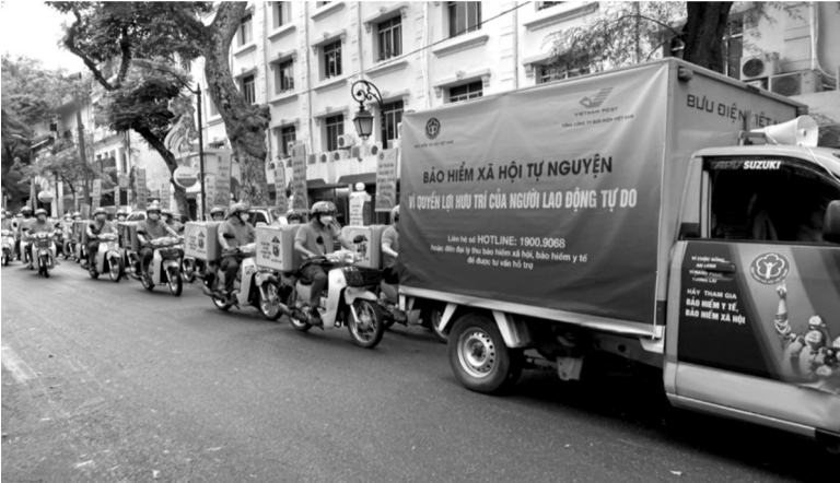
● Hơn 600 đoàn với 9.029 ô tô và xe gắn máy được sử dụng tham gia các tuyến đường trên toàn quốc.

Chỉ trong một ngày ra quân toàn quốc hưởng ứng Tháng vận động triển khai bảo hiểm xã hội (BHXH) toàn dân, ngành BHXH Việt Nam và Bưu điện Việt Nam đã phát triển được 22.306 người tham gia BHXH tự nguyện, 53.308 người tham gia bảo hiểm y tế (BHYT) hộ gia đình. Đây là con số vượt xa mục tiêu ban đầu, thể hiện ý nghĩa quan trọng của chính sách an sinh xã hội này.