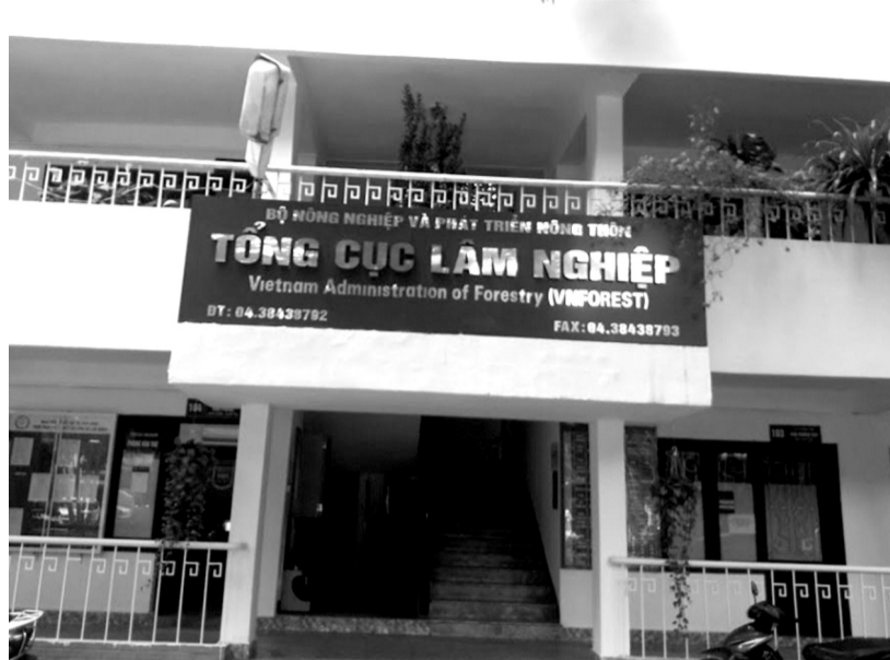
• Dự kiến Tổng cục Lâm nghiệp sẽ được sắp xếp lại thành 2 Cục thuộc Bộ NN&PTNT.

Bộ GTVT cũng giao Tổng cục Đường bộ Việt Nam theo dõi, đôn