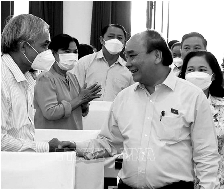
● Chủ tịch nước Nguyễn Xuân Phúc trao đổi với các cử tri.

Hôm qua (11/5), tiếp xúc với cử tri TP Hồ Chí Minh, Chủ tịch nước Nguyễn Xuân Phúc khẳng định, tinh thần là Đảng, Nhà nước, nhân dân ta tiếp tục coi nông nghiệp, nông thôn là “mặt trận” quan trọng, mức đầu tư vào “mặt trận” này cũng sẽ tăng tiếp tục 2 lần.