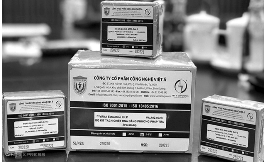
● Liên quan đến kit xét nghiệm của Công ty Việt Á, nhiều lãnh đạo CDC các tỉnh đã bị khởi tố.

Việc phân bổ thiết bị, kit test, vaccine tại một số thời điểm còn