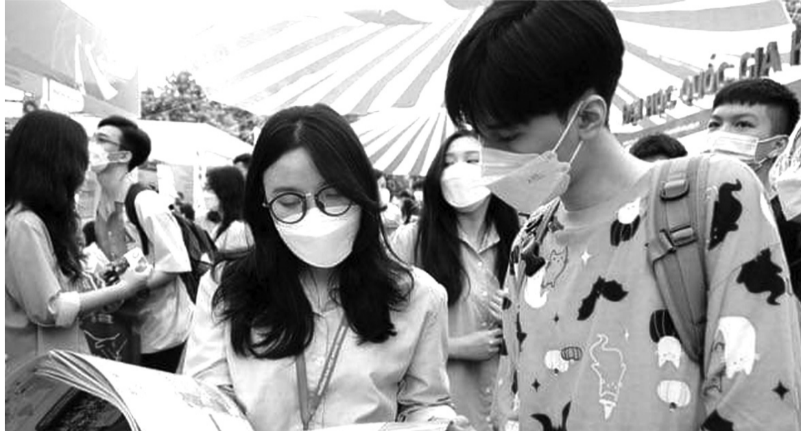
● Thí sinh tại Ngày hội tư vấn tuyển sinh 2022.

lượng tuyển sinh không hoàn toàn đảm bảo do không xét tuyển cùng một thời điểm (trường không có điều kiện để lựa chọn các thí sinh có chất lượng tốt hơn). Đặc biệt, một số cơ sở đào tạo xét thí sinh trúng tuyển nhưng không đưa lên hệ thống để loại các thí sinh này ra khỏi danh sách dự tuyển, làm ảnh hưởng đến kết quả lọc ảo chung của toàn hệ thống.