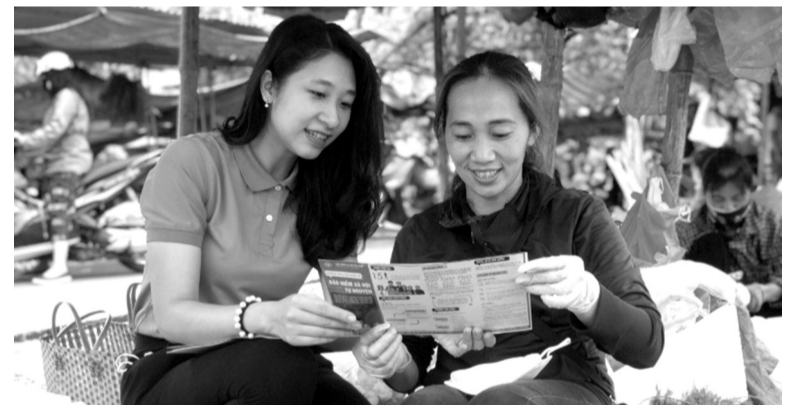
● Tuyên truyền chính sách BHXH tới người lao động tự do tại tỉnh Bắc Giang.

Bên cạnh đó, Tổng Giám đốc BHXH Việt Nam cũng đề nghị BHXH các tỉnh, thành phố cần chú trọng nâng cao hiệu quả công tác truyền thông để dân hiểu, dân biết, dân tin, dân nghe, dân theo, dân làm trong thực hiện chính sách BHXH, BHYT... Qua đó tạo hiệu ứng lan tỏa lâu dài nhằm phát triển nhanh và duy trì bền vững người tham gia vào hệ thống an sinh xã hội của đất nước. BUIANH