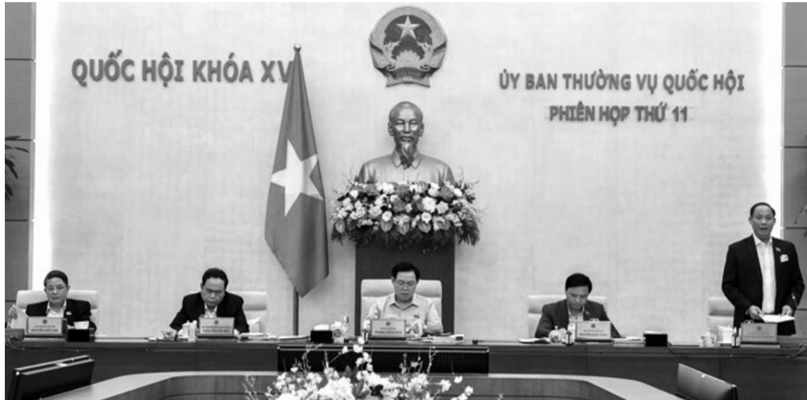
● Phó Chủ tịch Quốc hội Trần Quang Phương điều hành nội dung làm việc chiều 11/5.

Theo Dự thảo báo cáo tổng hợp ý kiến, kiến nghị của cử tri và nhân dân gửi đến Kỳ họp thứ 3, QH khóa XV do Chủ tịch Ủy ban Thường vụ Quốc hội Nguyễn Xuân Phúc trình bày tại phiên họp, cử tri và nhân dân vui mừng, phấn khởi, đánh giá cao sự lãnh đạo của Đảng, Nhà nước và những kết quả to lớn, toàn diện mà đất nước ta đã đạt được trên các lĩnh vực. Bên cạnh đó, cử tri và nhân dân còn trăn trở, băn khoăn, lo lắng về một số vấn đề, như những khó khăn, thách thức nhiều mặt do dịch COVID-19 gây ra; tiến độ giải ngân vốn đầu tư công và gói hỗ