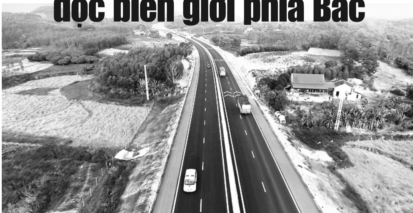
● Cao tốc Bắc Giang – Lạng Sơn.

Hai ngân hàng thương mại đã cam kết tài trợ vốn cho hai dự án cao tốc dọc biên giới phía Bắc là Chi Lăng - Hữu Nghị (địa phận tỉnh Lạng Sơn) và Đồng Đăng - Trà Lĩnh (địa phận hai tỉnh Lạng Sơn, Cao Bằng).