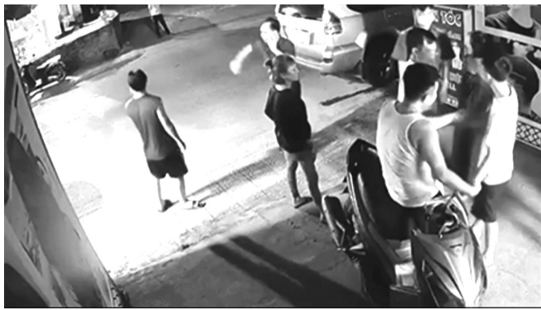
●Hình ảnh camera ghi lại vụ việc.