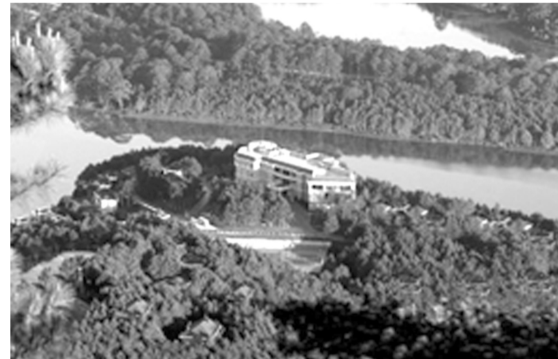
● Khu resort 5 sao đạt tiêu chuẩn quốc tế (Edensse) là một trong số ít dự án đưa vào khai thác kinh doanh ở KDL hồ Tuyền Lâm.

Về tình hình triển khai các dự án, hiện có 13 dự án đưa vào khai thác kinh doanh toàn bộ và một phần theo Giấy chứng nhận đầu tư được cấp (5 dự án khai thác kinh doanh toàn bộ và 8 dự án kinh doanh một phần).