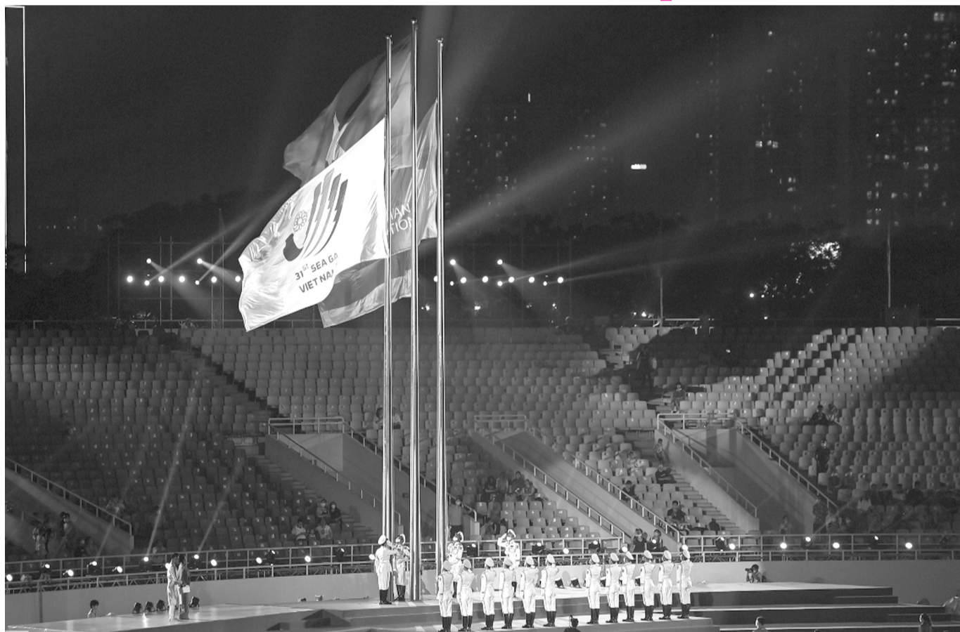
● Lễ thượng cờ Tổ quốc và cờ SEA Games tại lễ tổng duyệt.

Tối nay (12/5), Lễ khai mạc SEA Games 31 sẽ chính thức diễn ra với thông điệp “Vi một Đông Nam Á mạnh mẽ hơn - For a stronger South East Asia” được thể hiện cuốn hút thông qua một chương trình nghệ thuật mang tính biểu trưng, tương tác, đại chúng và đặc sắc.