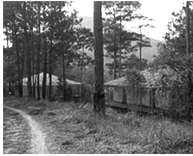
● Nhiều dự án tại KDL hồ Tuyên Lâm chậm tiến độ, chưa đưa vào khai thác kinh doanh.

chủ đầu tư viện đủ lý do, hoạt động cầm chừng, chủ yếu để giữ đất.