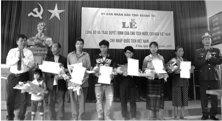
● Một buổi lễ công bố và trao quyết định cho nhập quốc tịch Việt Nam. (Ảnh minh họa)

Để triển khai Quyết định số 402/QĐ-TTg, Bộ trưởng Bộ Tư pháp đã kịp thời ban hành Quyết định số 514/QĐ-BTP ban hành Kế hoạch triển khai Thỏa thuận GCM của Bộ Tư pháp