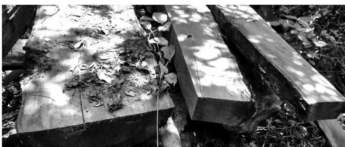
● Hình ảnh ghi nhận tại hiện trường vào trung tuần tháng 4/2022.