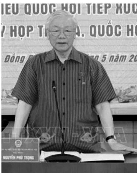
● Tổng Bí thư Nguyễn Phú Trọng phát biểu tại buổi tiếp xúc cử tri.

tri, Tổng Bí thư Nguyễn Phú Trọng nhấn mạnh, đất đai là vấn đề quan trọng, là tư liệu sản xuất cơ bản. Sắp tới, trên cơ sở Nghị quyết Hội nghị Trung ương 5 (khóa XIII), Quốc hội nghiên cứu, xem xét, sửa đổi Luật Đất đai theo tinh thần mới làm sao phát huy tối đa tiềm năng thế mạnh của đất nước.