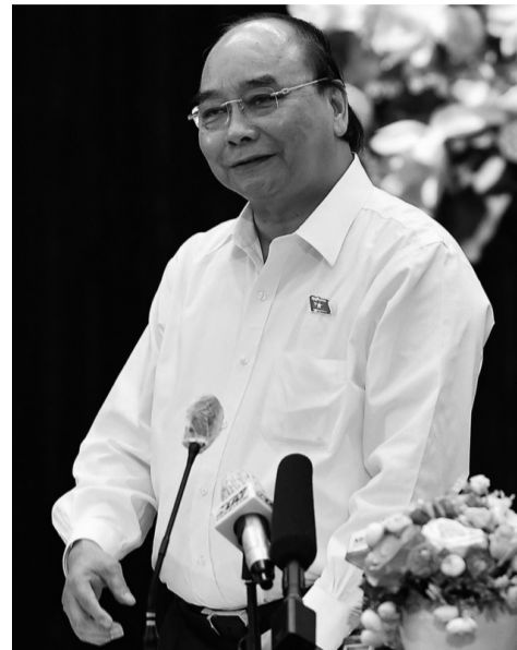
● Chủ tịch nước Nguyễn Xuân Phúc phát biểu tại buổi tiếp xúc cử tri.

Tổng Bí thư Nguyễn Phú Trọng cho biết, từ tháng 1 - 4/2022, một số vụ, việc