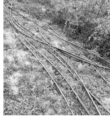
Người dân phải tự bỏ tiền mua ống dẫn nước từ các khe núi về sử dụng.