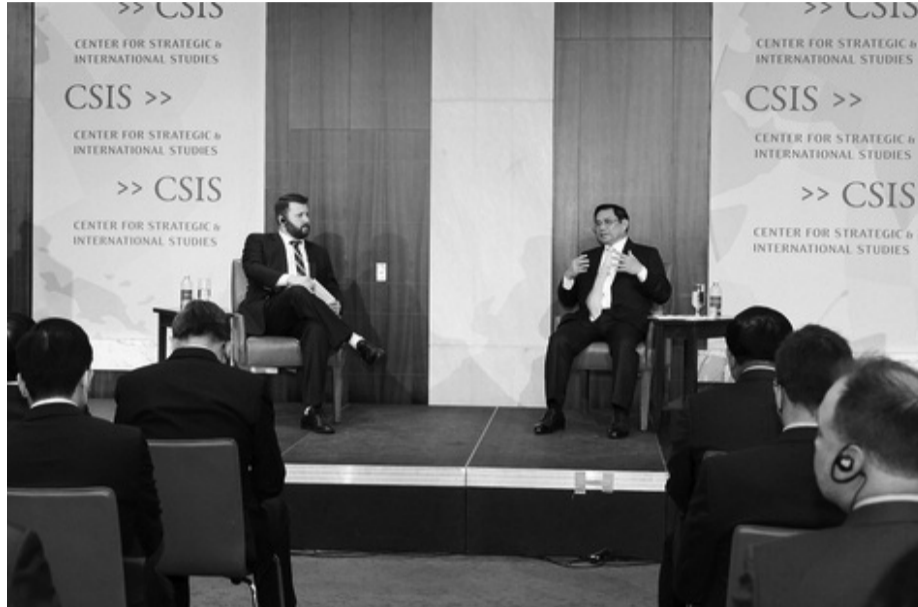
● Thủ tướng Phạm Minh Chính cùng Chủ tịch, Giám đốc điều hành CSIS thảo luận, làm rõ một số vấn đề.

Thứ hai, giữa độc lập và phụ thuộc, Việt Nam luôn chọn độc lập với tinh thần “Không có gì quý hơn độc lập, tự do” của Chủ tịch Hồ Chí Minh vĩ đại; giữa thương lượng và đối đầu, chúng tôi chọn thương lượng; giữa đối thoại và xung đột, chúng tôi chọn đối thoại; giữa hoà bình và chiến tranh, chúng tôi chọn hoà bình; giữa hợp tác và cạnh tranh, chúng tôi chọn hợp tác và cạnh tranh thì phải lành mạnh, bình đẳng, tôn trọng quyền và lợi ích hợp pháp, chính đáng của nhau. “Trong một thế