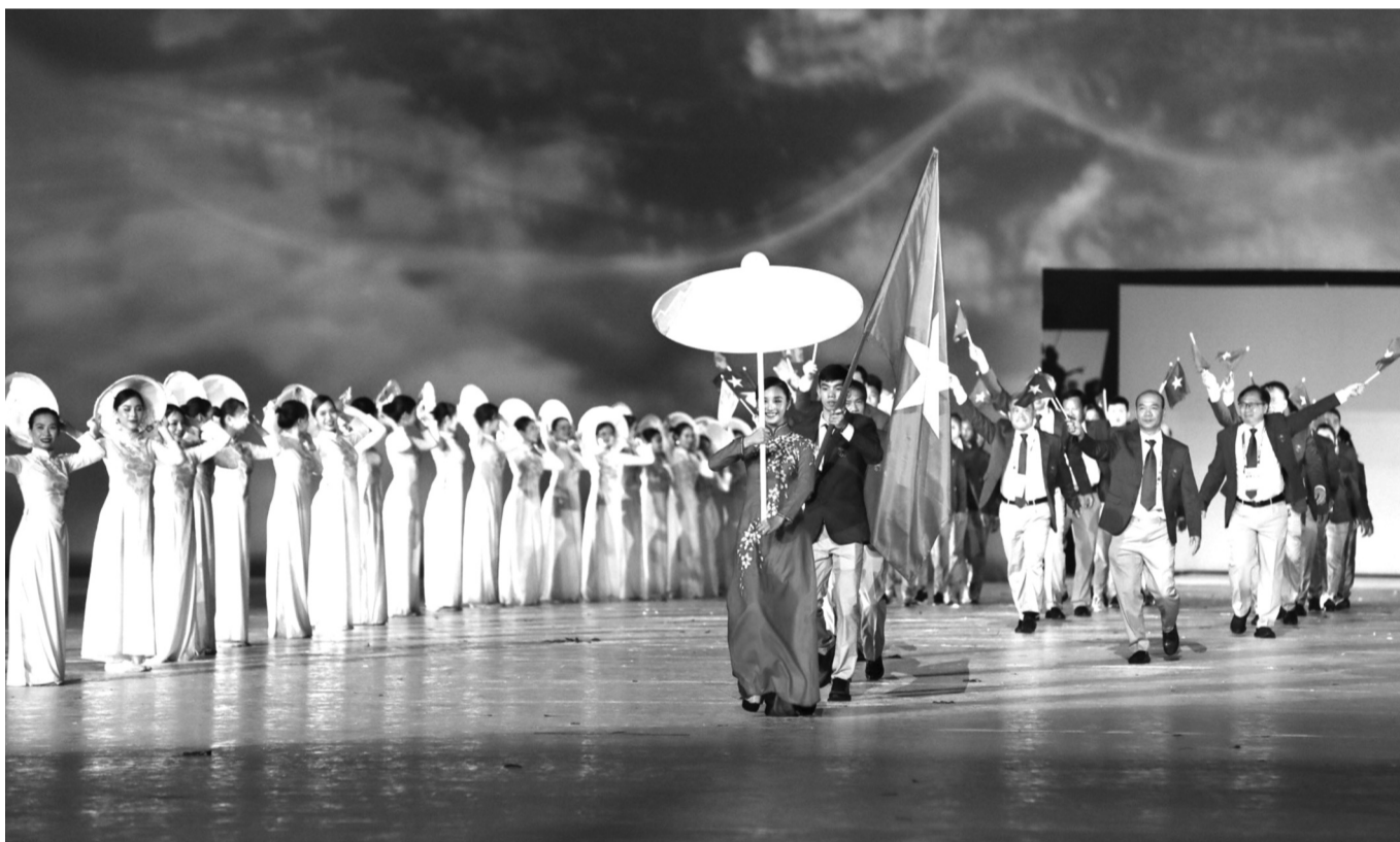
● Đoàn Thể thao Việt Nam diễu hành tại Lễ khai mạc.