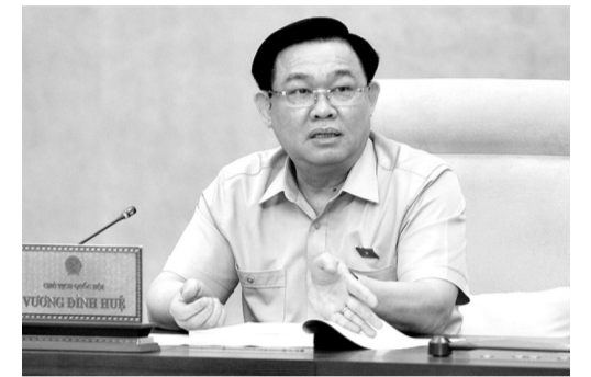
● Chủ tịch Quốc hội Vương Đình Huệ phát biểu tại phiên họp.

Đây là yêu cầu được Chủ tịch Quốc hội Vương Đình Huệ nhấn mạnh tại phiên họp của Ủy ban Thường vụ Quốc hội (UBTVQH) cho ý kiến về dự thảo Nghị quyết ban hành Nội quy kỳ họp Quốc hội (sửa đổi) diễn ra sáng qua (12/5).