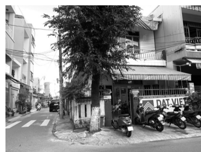
● Căn nhà 27 đã được bà Châu thỏa thuận mua lại, đặt cọc 3 tỷ cho ông Nam trước khi nhận cọc 2,5 tỷ để bán cho bà Luận.

Trước quan điểm của CQĐT, bị can Châu phản bác: “CQĐT nói tôi chưa đi niêm yết, chưa gặp bà Hiếu nhưng đã nói dối với bà Luận rằng xuất hiện người thừa kế; là không đúng. Ngày 9/9/2019, khi vợ chồng