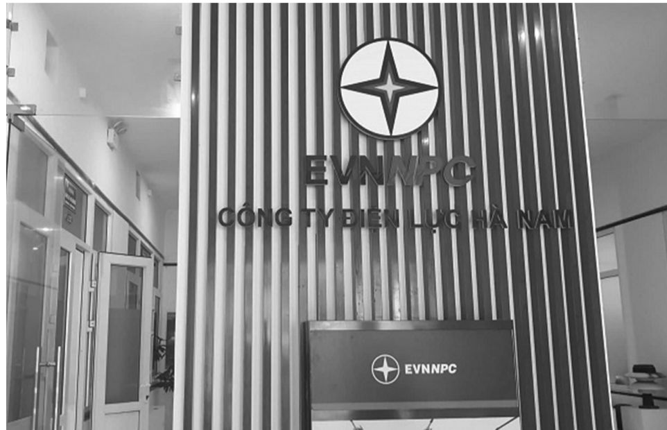
● Cty TVT đã tham gia và trúng nhiều gói thầu tại PC Hà Nam.

Tháng 3/2021, TVT liên danh với Cty TNHH Nam Thành trúng thầu "Sửa chữa lưới điện hạ thế sau TBA Đại Cường 5, Phủ Đề - Điện lực Kim Bảng". Giá trúng thầu hơn 2,8 tỷ đồng, phần công việc