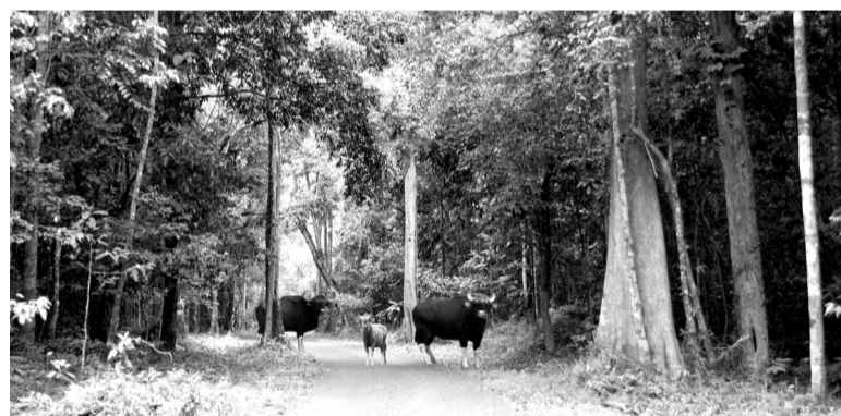
● Khu bảo tồn Đồng Nai là nơi cư trú của nhiều động vật hoang dã, quý hiếm.

qua KBT Đồng Nai thì khác. Hiện nhóm thú lớn ở KBT Đồng Nai chịu tác động nặng nề nhất của việc mở QL13C là quần thể voi châu Á (khoảng 20 con) và bò rừng (200 con) có phạm vi hoạt động rất rộng, di chuyển tìm kiếm thức ăn liên tục. Nếu xây dựng hệ thống hàng rào chắn 2 bên đường không thích hợp cho đời sống hoang dã, khi 2 loài này đang có sức khỏe sinh sản tốt, những tập tính di chuyển kiếm ăn của chúng hình thành như một phản xạ tự nhiên rất khó thay đổi. Việc xây cầu cạn giao thông