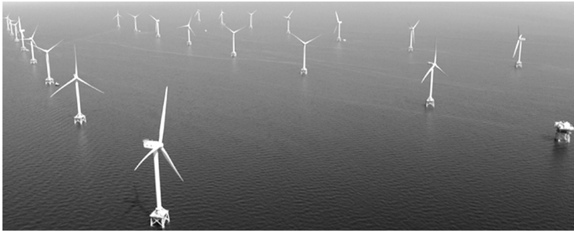
● Tiềm năng điện gió ngoài khơi Việt Nam rất lớn.

Equinor (Na Uy) là công ty năng lượng lớn của Na Uy (Chính phủ Na Uy sở hữu 67%). Đại diện Tập đoàn này khẳng định, việc mở văn phòng