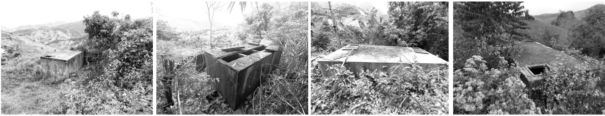
Hàng loạt công trình nước sinh hoạt tại Quỳnh Nhai bị bỏ hoang nhiều năm, lãng phí.

lòng hồ chuyển về theo dự án di dân tái định cư thủy điện Sơn La. Hiện hầu hết các công trình đã xuống cấp không còn hoạt động, một số bể nước bị bỏ hoang từ nhiều năm. Bên trong bể, mực nước chưa đầy gang tay, màu đen sì, trở thành nơi trú ngụ của bọ gậy. Trong khi người dân phải sống trong cảnh thiếu nước sinh hoạt, nhất là vào mùa khô, khan hiếm nước một số hộ phải dùng can, xô xuống lấy nước từ sông Đà về sử dụng. Còn những việc như trồng rau, nuôi gà, lợn... thì không thể làm được vì không có nước.