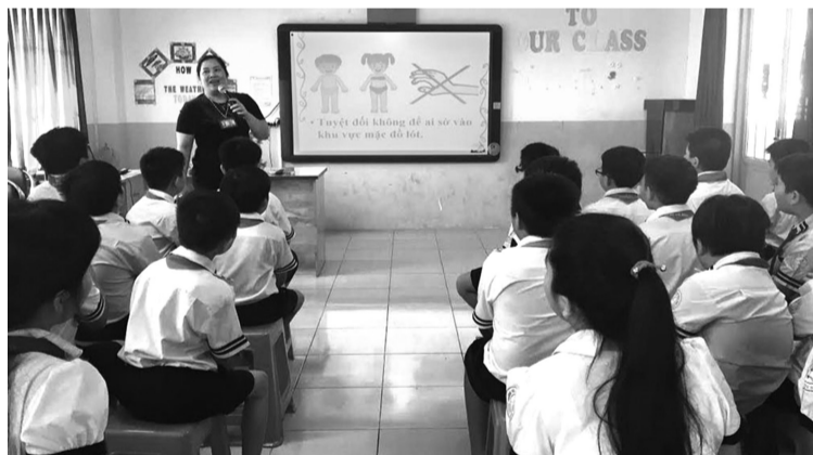
● Nên sớm cải thiện giáo dục giới tính trong trường học. (Ảnh minh họa)