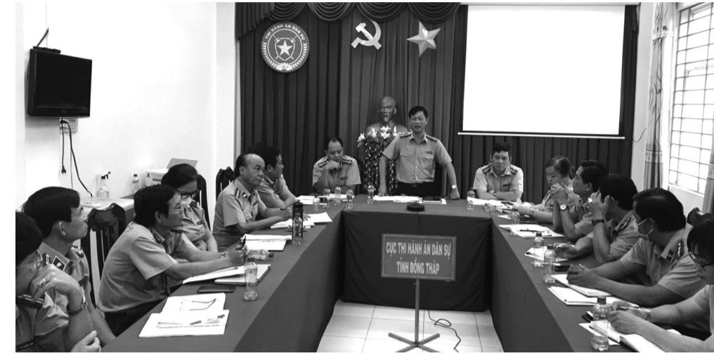
● Hội nghị sơ kết công tác THADS, theo dõi THAHC 6 tháng đầu năm của Cục THADS Đồng Tháp.

Tuy nhiên, ở một vài đơn vị chỉ tiêu về tiền, về việc còn chưa bảo đảm tiến độ, kế hoạch, mặc dù do nguyên nhân khách quan như số tiền thụ lý mới có giá trị lớn, đang trong giai đoạn đầu xác minh, áp dụng biện pháp bảo đảm thi hành án, chưa xử lý được... Bên cạnh vẫn còn một số nguyên nhân chủ quan là chưa chủ động, còn chậm tiến độ trong xử lý vụ việc, chưa có giải pháp thi