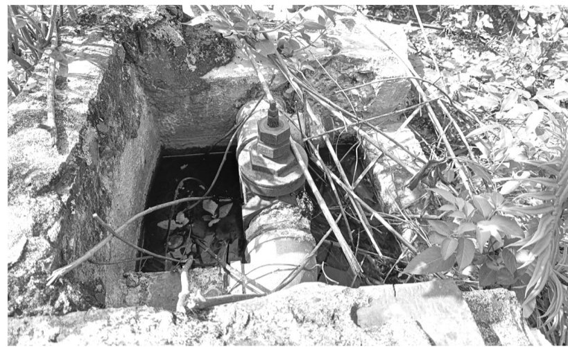
● Huyện Quỳnh Nhai có 132 công trình nước sinh hoạt tập trung nông thôn, nhưng 60 công trình không còn hoạt động, 51 công trình hoạt động kém hiệu quả.

Những năm qua, một số địa phương trên địa bàn huyện Quỳnh Nhai đã được tiếp cận các nguồn vốn để đầu tư xây dựng cơ sở hạ tầng, phát triển kinh tế, an sinh xã hội, xây dựng các công trình nước sinh hoạt nhằm giúp chất lượng cuộc sống người dân ngày càng được nâng lên. Tuy nhiên, trái với sự mong đợi, hiện nhiều công trình cấp nước trên địa bàn huyện đang bị bỏ hoang hoặc hoạt động không hiệu quả, trong khi người dân thiếu nước sử dụng, lãng phí tài sản... Tình trạng này xảy ra tại các xã Cà