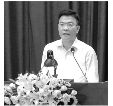
● Bí thư Ban cán sự đảng, Bộ trưởng Lê Thành Long kết luận Hội nghị.

XDPL cần nghiên cứu một cách có hệ thống các chủ trương, đường lối của Đảng để thể chế hóa, cụ thể hóa đúng, đầy đủ, kịp thời. Thủ trưởng các đơn vị cần có định hướng và tổ chức thực hiện cụ thể trong toàn đơn vị, tới tất cả các cán bộ, công chức. Công tác kiểm tra văn bản cần bao quát rộng hơn về số lượng, quyết liệt hơn nữa trong yêu cầu xử lý, kịp thời đề xuất, kiến nghị cơ quan có thẩm quyền xem xét, giải quyết. Các đơn vị thực hiện nhiệm vụ quản lý nhà nước cần thường xuyên liên hệ, trao đổi về chuyên môn với các đơn vị XDPL.