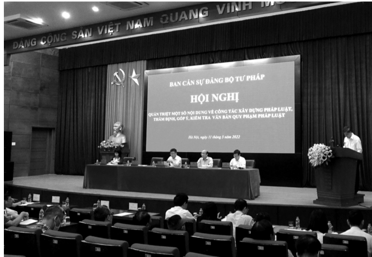
● Quang cảnh Hội nghị.

thảo luận, đánh giá về những tồn tại, hạn chế liên quan đến công tác XDPL, đưa ra các giải pháp nâng cao hiệu quả công tác này, đảm bảo đúng định hướng của Đảng, pháp luật của Nhà nước. Qua đó góp phần nâng cao nhận thức, bản lĩnh chính trị, lập trường tư tưởng, trách nhiệm công vụ của từng cán bộ, từng lãnh đạo cấp phòng, cấp vụ, cấp bộ trong quy trình XDPL.