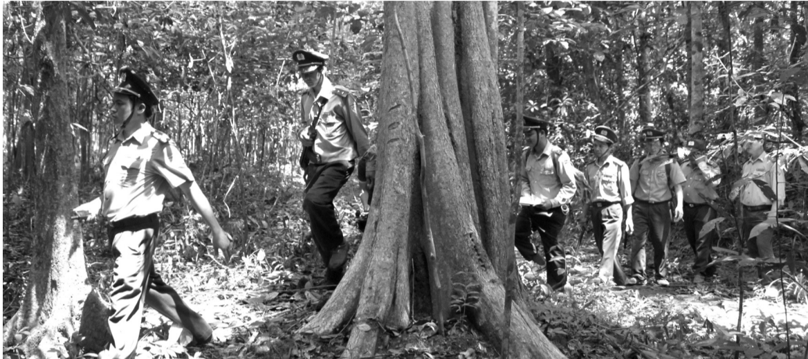
● Kiểm lâm khu bảo tồn Đồng Nai tuần tra, bảo vệ rừng.

Tỉnh Bình Phước vừa đề xuất xây cầu Mã Đà và mở QL13C kết nối với Đồng Nai xuyên qua vùng lõi Khu bảo tồn thiên nhiên – văn hóa Đồng Nai được UNESCO công nhận là Khu dự trữ sinh quyển thế giới. Nhiều chuyên gia, nhà khoa học và UBND tỉnh Đồng Nai đã lên tiếng phản đối đề xuất này.