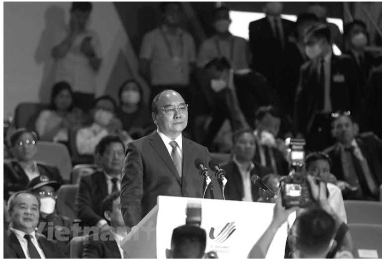
● Chủ tịch nước Nguyễn Xuân Phúc tuyên bố khai mạc SEA Games lần thứ 31 tại Việt Nam.