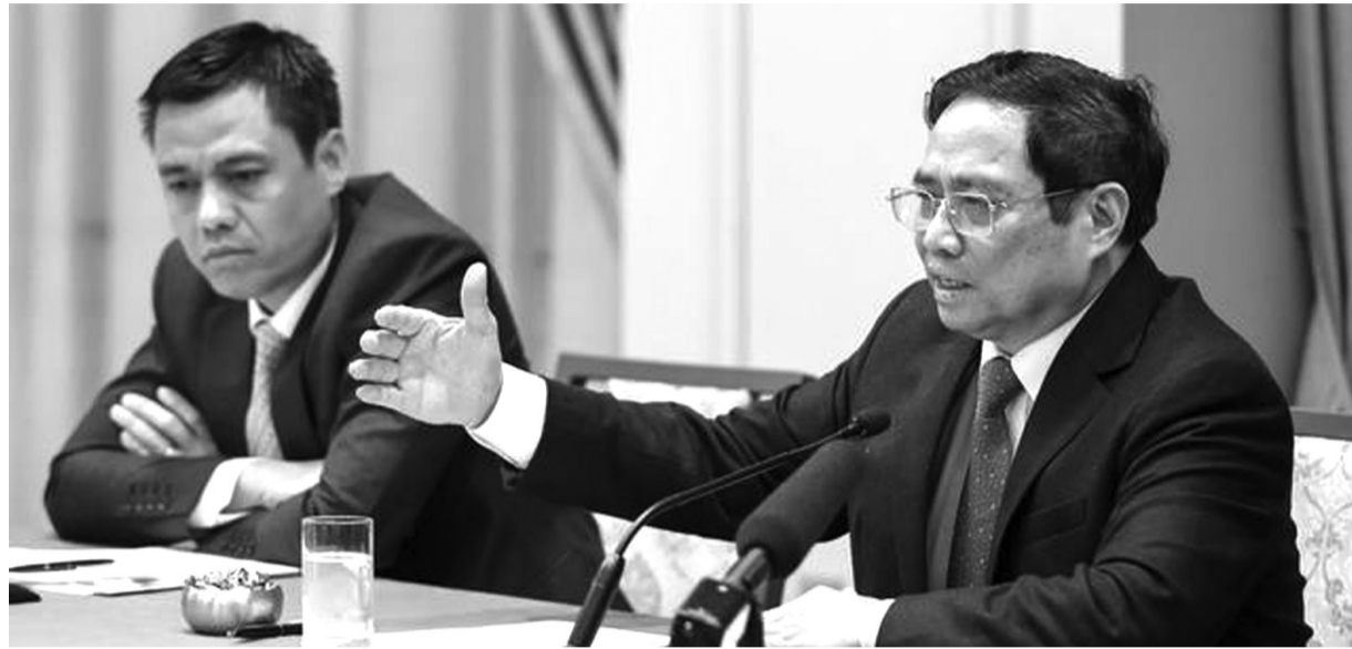
● Thủ tướng Phạm Minh Chính trả lời các câu hỏi của trí thức Việt kiều, sinh viên Việt Nam tại New York.

Gặp các trí thức, sinh viên Việt kiều tại New York (Mỹ), Thủ tướng Phạm Minh Chính mong mỗi người là một “đại sứ” tiếp tục đóng góp để nâng cao hình ảnh, ảnh hưởng Việt Nam trong mắt bạn bè, đối tác quốc tế.