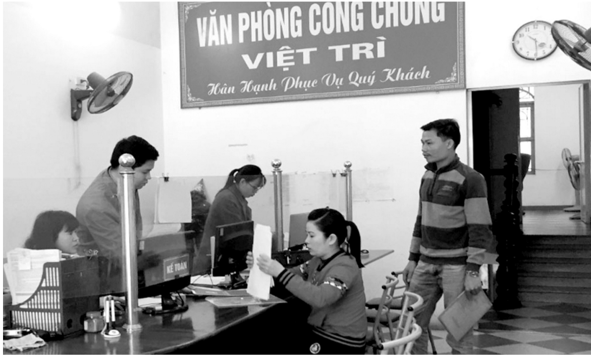
● Ảnh minh họa.

Quy định về vị trí, vai trò của tổ chức xã hội - nghề nghiệp của công chứng viên trong Luật Công chứng hiện nay còn rất mờ nhạt. Do đó, tổ chức này chưa phát huy thực sự hiệu quả trên thực tế.