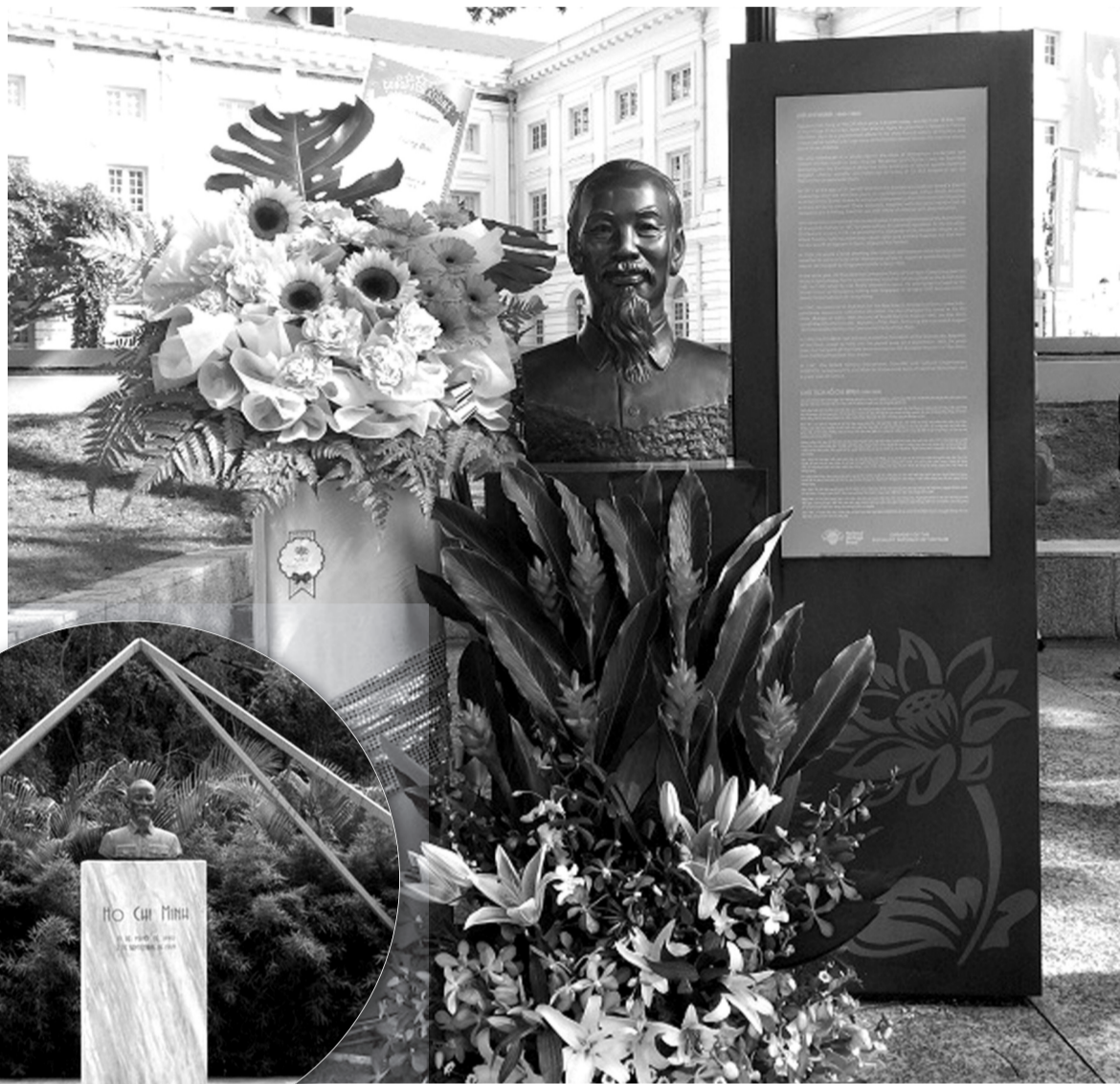
●Tượng đài Bác Hồ tại Công viên Bảo tàng Văn minh châu Á (Singapore).

Những tượng đài, những nơi lưu niệm điếm dừng chân ý nghĩa ở nước ngoài của Chủ tịch Hồ Chí Minh ở nước ngoài và các hoạt động sôi nổi trong nước, quốc tế đã, đang và sẽ tiếp tục diễn ra cho thấy “Hồ Chí Minh là một con người của truyền thuyết và của mọi thời đại, một nhân vật như vẫn đang sống cùng chúng ta ngày nay. Hồ Chí Minh không phải là ký ức của quá khứ. Sự vĩnh hằng trong tư tưởng Hồ Chí Minh làm cho Người trở thành bất