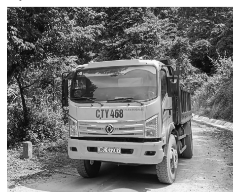
● Xe chở vật liệu từ một mỏ đá trái phép.

dân tái định cư thủy điện Sơn La (hiện đã sáp nhập với BQL dự án đầu tư xây dựng các công trình NN&PTNT tỉnh Sơn La) làm chủ đầu tư. Dự án còn lại do UBND huyện làm chủ đầu tư, đại diện chủ đầu tư