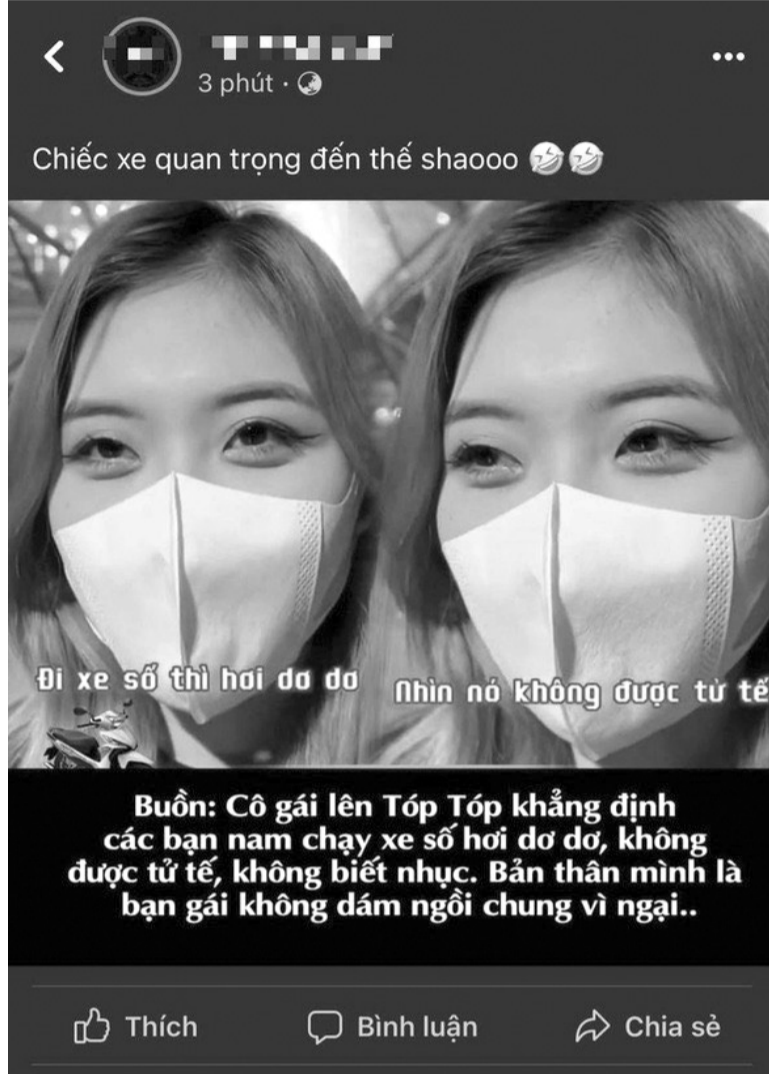
● Đoạn cắt từ clip “giả mạo” cô gái phát ngôn chê người đi xe số.

Không cắt ghép hình ảnh nạn nhân với những câu phát ngôn sốc, nhiều kênh trên mạng xã hội lại “cắt lời nói” để “câu view”. Những người bị “cắt đoạn” câu nói thường là người nổi tiếng, người tham gia các chương trình truyền hình thực tế, hoặc cũng có thể là người bình thường được phỏng vấn và cắt ghép lời nói... Câu nói một khi xuất hiện trong ngữ cảnh nhất định thì không sao, nhưng một khi bị cắt ghép, lại dùng chiêu trò tạo drama thì dễ gây hiểu lầm, khiến chủ nhân của