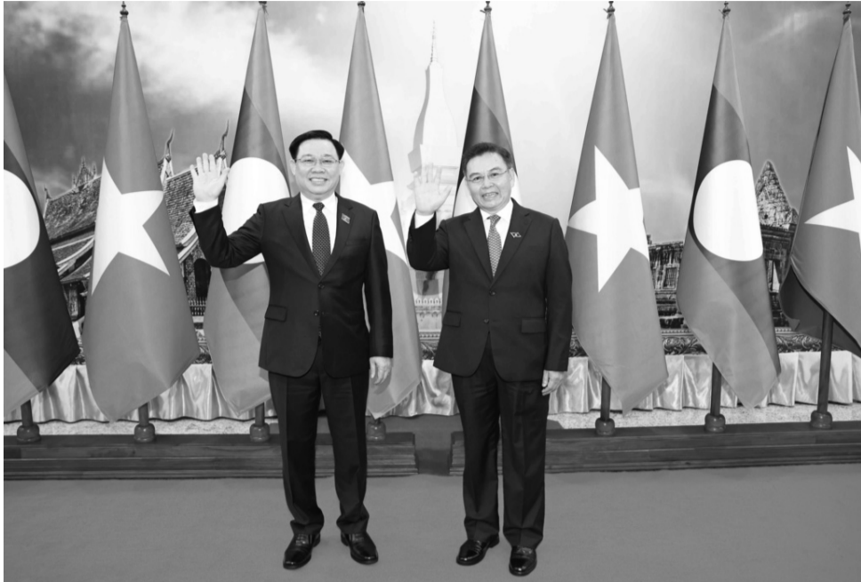
● Chủ tịch Quốc hội Vương Đình Huệ và Chủ tịch Quốc hội Lào Saysomphone Phomvihane.

Chủ tịch Quốc hội hai nước Việt Nam – Lào khẳng định sẽ đẩy mạnh hợp tác thương mại, đầu tư, kết nối hai nền kinh tế; phối hợp tìm giải pháp tháo gỡ khó khăn, vướng mắc cho các dự án hợp tác giữa hai nước.