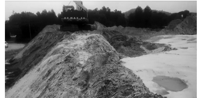
● Một bãi nguyên vật liệu xây dựng dấu hiệu trái phép tại Lục Nam.

Trước phản ánh này, ông Nguyễn Văn Thạch, Chủ tịch UBND xã Cẩm Lý cho biết: UBND xã đã kiểm tra và thấy đường băng tải được hình thành trong khu sản xuất của Cty, không ảnh hưởng đến đi lại cũng như cuộc sống bà con. Tuy nhiên, điểm tập kết nguyên liệu thì chưa có phép mà chỉ là hợp đồng thuê đất của người dân để sử dụng.