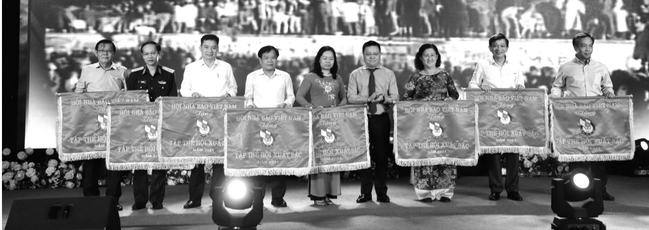
● Trao tặng Cờ thi đua của Hội Nhà báo Việt Nam cho 8 đơn vị đạt danh hiệu tập thể xuất sắc năm 2021.

Đây là nhấn mạnh của ông Lê Quốc Minh, Ủy viên Trung ương Đảng, Phó Trưởng Ban Tuyên giáo Trung ương, Tổng Biên tập Báo Nhân dân, Chủ tịch Hội Nhà báo Việt Nam tại Hội nghị triển khai công tác Hội năm 2022 diễn ra chiều qua (16/5).