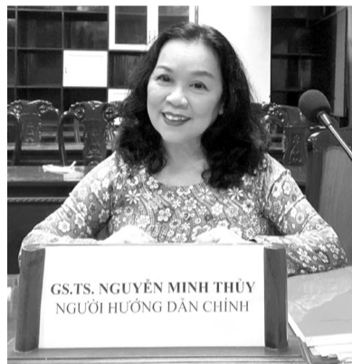
● Với Giáo sư Thủy, nghiên cứu khoa học và nghề giáo là hai lĩnh vực không tách rời nhau, mà còn mang lại “sự hỗ trợ tuyệt vời”.