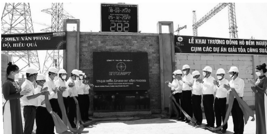
● Lắp đặt hồ đếm ngược để đẩy tiến độ dự án giải tỏa công suất Nhiệt điện BOT Vân Phong 1.

Đồng thời trong năm 2022, EVNNPT cũng đã lập kế hoạch và đang tập trung chỉ đạo đẩy nhanh tiến độ công tác chuẩn bị đầu tư để sớm khởi công, thi công và đưa vào vận hành các dự án phục vụ giải tỏa công suất các nguồn