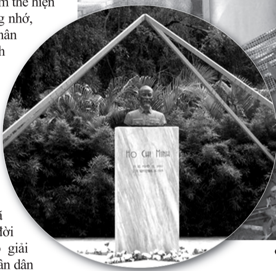
●Tượng đài Chủ tịch Hồ Chí Minh được xây dựng nổi bật giữa Công viên Hòa Bình, trung tâm Thủ đô La Havana.