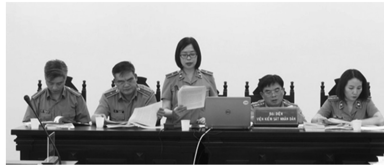
● Viện kiểm sát: “Các bị cáo chỉ vì ham muốn tìm kiếm lợi nhuận, thu lợi bất chính mà bất chấp pháp luật và đạo đức”.

Tiếp lời, vị này cho rằng cáo trạng quy buộc Cường về hành vi thiếu trách nhiệm gây hậu quả nghiêm trọng trong việc thành lập,