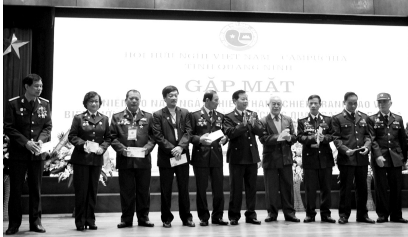
● Hội Hữu nghị Việt Nam - Campuchia tỉnh Quảng Ninh tặng quà, hỗ trợ những hội viên gặp khó khăn.

Thứ nhất , người làm việc trong cơ quan Đảng, Nhà nước, lực lượng vũ trang, Mặt trận Tổ quốc Việt Nam, tổ chức chính trị - xã hội hưởng lương từ ngân sách nhà nước được cử làm chuyên gia tại Lào đến hết ngày 31/12/1988 và tại Campuchia đến hết ngày 31/8/1989, nay đã nghỉ hưu hoặc nghỉ việc vì mất sức lao động nhưng chưa được hưởng chế độ trợ cấp theo quy định tại khoản 7 Điều 2 Quyết định số 87-CT ngày 01/3/1985 của Chủ tịch Hội đồng Bộ trưởng về chế độ, chính sách đối với cán bộ sang giúp Lào và Campuchia hoặc người đang công tác hoặc người nghỉ việc chờ hưởng chế độ hưu trí hoặc người đã thôi việc.