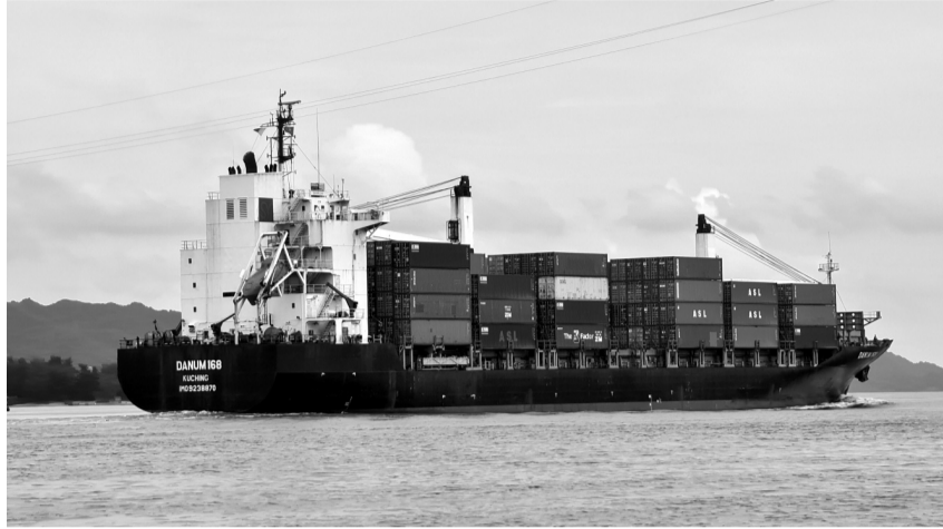
● Doanh nghiệp vận tải biển, cảng biển sẽ tiếp tục kinh doanh thuận lợi trong năm nay

Sản lượng hàng hóa qua cảng biển tăng, cước phí vận tải biển tăng... là những nguyên nhân chủ yếu khiến doanh thu, lợi nhuận của các doanh nghiệp kinh doanh vận tải biển từ đầu năm đến nay “ăn nên làm ra”.