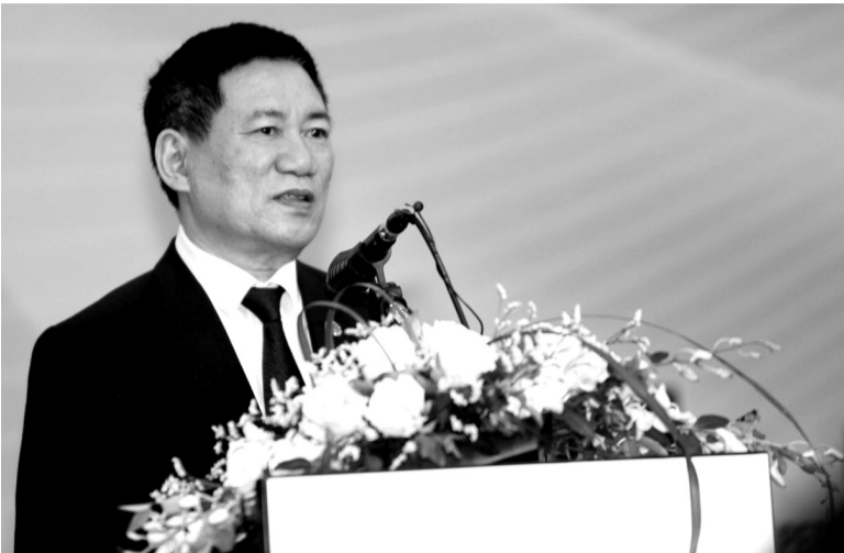
● Bộ trưởng Bộ Tài chính Hồ Đức Phớc phát biểu tại Hội thảo.