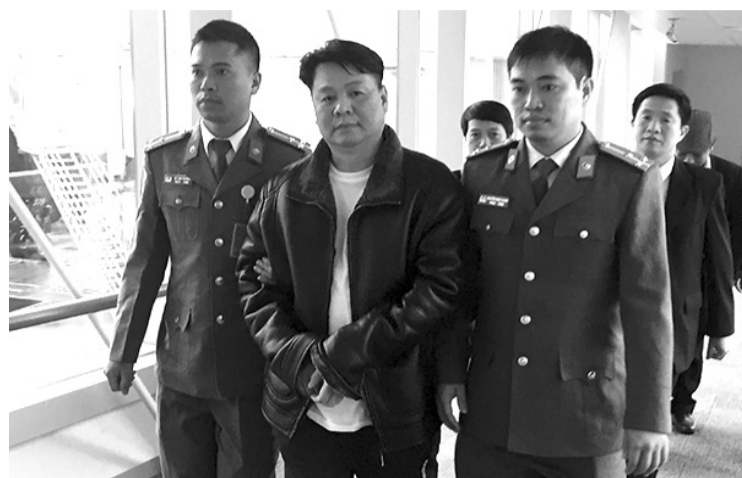
● Lực lượng Công an Việt Nam dẫn giải đối tượng truy nã.

Theo dự thảo, việc phối hợp trong thực hiện một số hoạt động hợp tác quốc tế trong TTHS phải tuân thủ Hiến pháp, pháp luật Việt Nam; phù hợp với các điều ước quốc tế mà Việt Nam là thành viên; bảo đảm tuân thủ đúng chức năng, nhiệm vụ của mỗi cơ quan theo quy định của pháp luật. Đồng thời, phải được thực hiện