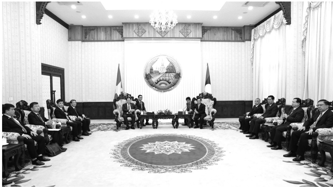
● Quang cảnh buổi hội kiến.

Chủ tịch QH Vương Đình Huệ khẳng định, QH Việt Nam đặc biệt coi trọng công tác xây dựng và hoàn thiện thể chế, pháp luật để đáp ứng yêu cầu của sự nghiệp đổi mới và hội nhập quốc tế, luôn ủng hộ và tích cực giám sát, thúc đẩy việc