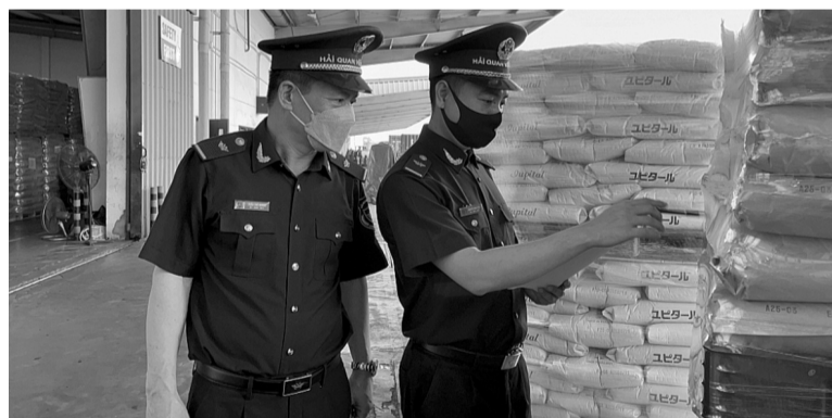
● Công chức Chi cục Hải quan KCN Bắc Thăng Long kiểm tra hàng hóa xuất nhập khẩu. (ảnh minh họa)

khai Cơ chế một cửa quốc gia và Cơ chế một cửa ASEAN theo hướng tập trung hóa, hiện đại hóa, tự động hóa công tác quản lý điều hành nghiệp vụ hải quan, công tác tham mưu, thực thi nghiệp vụ kiểm tra, giám sát, kiểm soát hải quan.