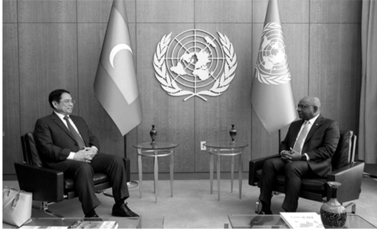
● Thủ tướng Chính phủ Phạm Minh Chính gặp Chủ tịch Đại Hội đồng LHQ Abdulla Shahid.

Thủ tướng khẳng định Việt Nam quyết tâm triển khai các cam kết tại Hội nghị COP26 và đề nghị LHQ hỗ trợ Việt Nam trong thiết lập quan hệ đối tác về chuyển đổi năng lượng với các nước G7, xây dựng chiến lược tài chính khí hậu để huy động hiệu quả nguồn lực hỗ trợ từ các đối tác phát triển quốc tế. Thủ tướng cũng đề nghị LHQ tiếp tục hỗ trợ Việt Nam hoàn thành các Mục tiêu Phát triển Bền vững (SDGs), tăng cường hỗ trợ Việt Nam trong việc tham gia các hoạt động gìn giữ hoà bình của LHQ, tiếp tục hợp tác khắc phục hậu quả chiến tranh tại Việt Nam.