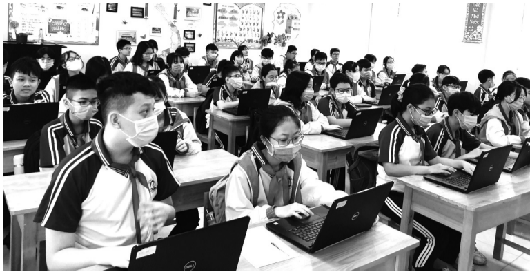
● Hải Phòng chú trọng đẩy mạnh CDS trong lĩnh vực GD&ĐT.