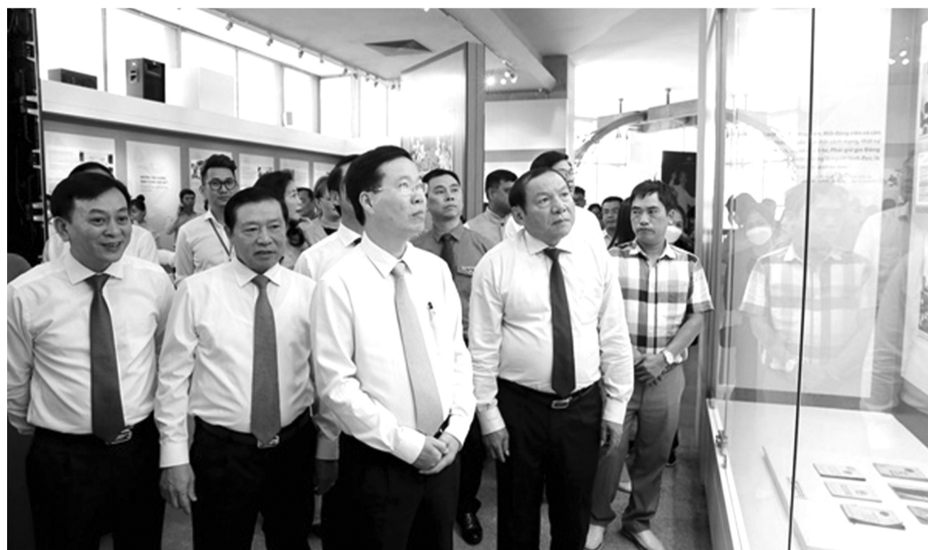
● Lãnh đạo Đảng, Nhà nước tham quan triển lãm.