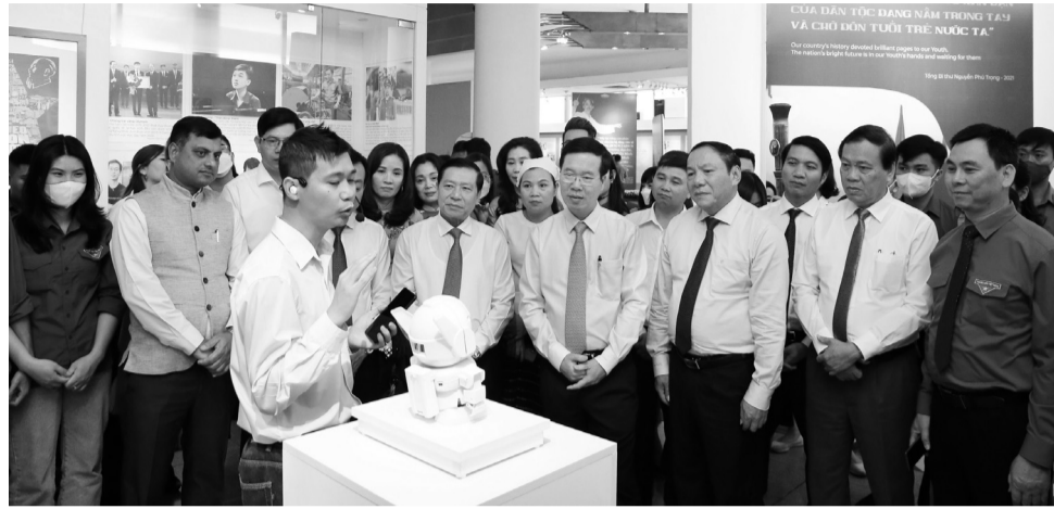
● Lãnh đạo Đảng, Nhà nước tham quan triển lãm.