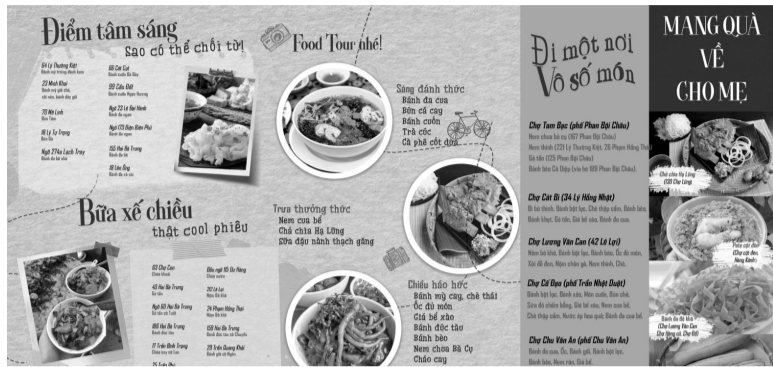
● Trào lưu du lịch “foodtour” Hải Phòng.

khóa “du lịch”. Còn trên mạng Facebook theo trang thông tin L'Écho Touristique của Pháp, các chuyên trang như “Paris Je t'aime”, hoặc “Géo France” tạo ra hàng chục triệu lượt tương tác liên quan đến các điểm tham quan thú vị nhất. Điển hình, tại điểm du lịch nổi tiếng như Hội An, các điểm dịch vụ du lịch như resort, quán ăn, cà phê hay chỗ vui chơi được nhiều review tốt trên các nền tảng mạng xã hội đều trở nên đông đúc khách hơn.