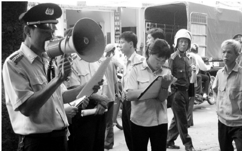
● Một buổi thi hành án dân sự. (Ảnh minh họa)

Luật THADS đã quy định rõ về một số trường hợp truy cứu trách nhiệm hình sự đối với hành vi không chấp hành án. Tuy nhiên, Luật THADS và các văn bản hướng dẫn thi hành chưa có quy định cụ thể về thủ tục cũng như các loại văn bản cần phải chuyển giao cho cơ quan Công an trong quá trình đề nghị truy cứu trách nhiệm hình sự. Điều này dẫn đến các cơ quan THADS địa phương gặp nhiều khó khăn trong việc áp dụng pháp luật. Do đó, cần có quy định rõ thủ tục và các loại văn bản mà cơ quan THADS cần chuyển giao đến cơ quan có