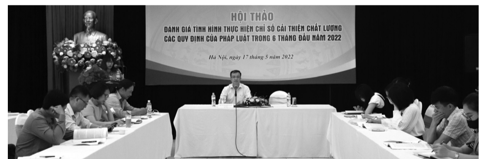
● Toàn cảnh Hội thảo.

Công tác rà soát, kiểm tra VBQPPL đạt được nhiều kết quả tích cực, đặc biệt là chất lượng VBQPPL do các bộ, cơ quan ngang bộ và chính quyền cấp tỉnh xây dựng, ban hành ngày càng được nâng cao hơn; số văn bản có quy định trái pháp luật đã có chiều hướng giảm hơn so với các năm trước. Công tác lập chương trình xây dựng luật, pháp lệnh được thực hiện theo đúng quy định của Luật Ban hành VBQPPL năm 2015 (đã được sửa đổi, bổ sung năm 2020) và các văn bản quy định chi tiết, hướng dẫn thi hành. Công tác hoàn thiện pháp luật về xây dựng, ban hành