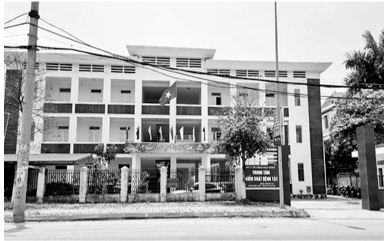
● Trung tâm Kiểm soát bệnh tật tỉnh Hòa Bình.

Do đó, Thanh tra tỉnh Hòa Bình không tiến hành làm việc với Công ty Việt Á để thu thập hồ sơ tài liệu, hóa đơn đầu vào