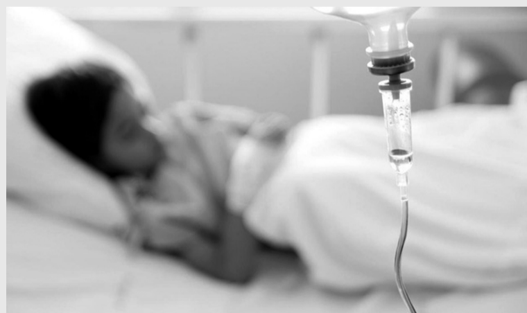
● Ngành Y tế Việt Nam đề cao cảnh giác với bệnh viêm gan cấp tính không rõ nguyên nhân. (Ảnh minh họa)

Tuy chưa ghi nhận tại Việt Nam nhưng thông tin về bệnh viêm gan không rõ nguyên nhân ở trẻ tại một số quốc gia vẫn khiến các bậc phụ huynh lo lắng. Theo chuyên gia y tế, việc cần thiết là bình tĩnh và chủ động tìm giải pháp phòng, chống căn bệnh nguy hiểm này.