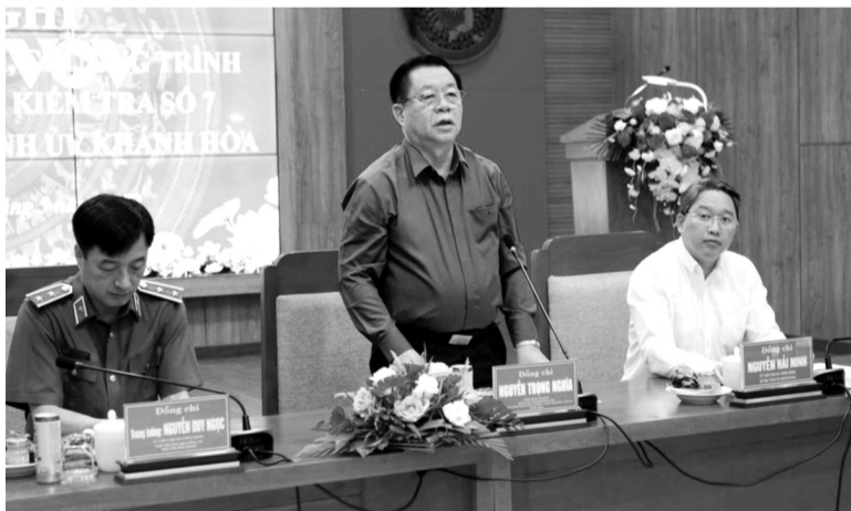
● Trưởng Ban Tuyên giáo Trung ương Nguyễn Trọng Nghĩa phát biểu chỉ đạo tại hội nghị.

ương Nguyễn Trọng Nghĩa yêu cầu các thành viên Đoàn kiểm tra và Tỉnh ủy Khánh Hòa cần chủ động, tích cực, đồng bộ và quyết liệt những yêu cầu đặt ra trong đợt kiểm tra nhưng vẫn giữ nguyên tắc cao nhất là công tâm, không chủ quan, thận trọng, chặt chẽ, chính xác, nghiêm minh. Qua công tác kiểm tra phải thể hiện được tinh thần chiến đấu cao, không bao che, không bỏ qua thiếu sót, khuyết điểm, vi phạm của tổ chức, cá nhân nêu có; thể hiện tinh thần đoàn kết, nhất trí cao, vì nhiệm vụ chung của công tác xây dựng Đảng.