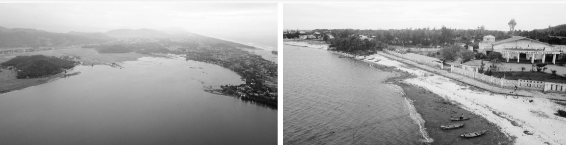
● Đầm An Khê hiện nay và Nhà trưng bày văn hóa Sa Huỳnh.

Hội đồng đề nghị không lập đặt các tấm panel thu năng lượng mặt trời trên mặt nước và xây dựng các công trình vận hành, quản lý dự án đất bờ đầm An Khê; cũng không thể thu hẹp một phần đầm An Khê được vì sẽ vi phạm khu vực bảo vệ của di tích theo qui định của Luật Di sản văn hóa năm 2001 được sửa đổi, bổ sung năm 2009 và vi phạm “tính xác thực”, “tính toàn vẹn” của di sản tại Công ước về bảo vệ di sản văn hóa và thiên nhiên thế giới 1972.