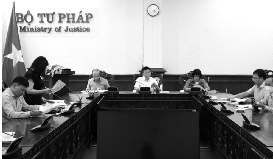
● Bộ trưởng Lê Thành Long (ngồi giữa) chủ trì buổi làm việc.