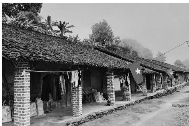
● Những ngôi nhà trình tường tại Nà Rèo - Tam Hợp.

Nét độc đáo trong kiến trúc ngôi nhà trình tường Nà Rèo của người Dao Tiền tương đối thống nhất theo một khuôn mẫu, dù to hay nhỏ đều phải có ba gian, hai cửa, gồm: một cửa chính giữa nhà và một cửa phụ ở đầu hồi nhà bên trái, hoặc bên phải để ra chuồng trâu, chuồng lợn phía sau. Ngoài ra, còn làm thêm 2 cửa sổ ở bên trái, bên phải ló ra vào và một cửa sổ ở gian bếp. Ba gian nhà được sắp xếp theo mô hình gian bên trái dùng để đặt buồng ngủ của gia chủ; gian bên phải là buồng ngủ của con cái (thường có cửa buồng kín đáo); gian giữa thường rộng hơn hai gian bên và là gian để bàn thờ tổ tiên, bày bàn ghế tiếp khách, một số gia đình đặt thêm 1 - 2 giường dành cho khách. Bên trong nhà còn làm thêm một bức tường phụ cũng bằng đất nện chạy song song với tường chính. Sau bức tường phụ này chính là khu vực bếp. Nhà trình tường nào cũng có sàn gác để cất giữ đồ đạc, lương thực, thực phẩm. Trên bếp luôn có gác bếp nhỏ chứa lương thực, thực phẩm để khỏi bếp hạn chế được sâu mọt, ẩm mốc.