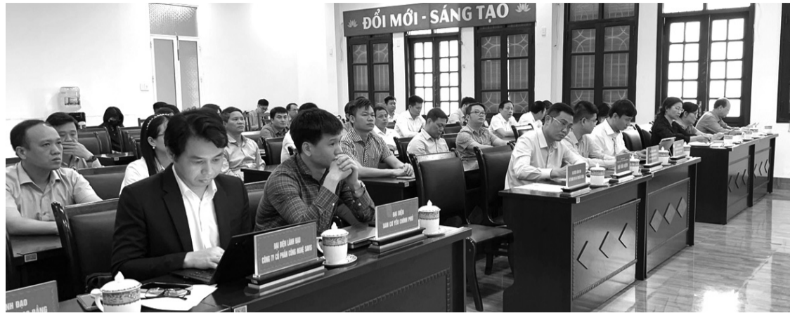
● Quang cảnh Hội thảo.

nhằm hiện thực hóa CDS trên mọi lĩnh vực đời sống xã hội với 3 trụ cột chính quyền số, kinh tế số và xã hội số. Trong đó, CDS lĩnh vực GD&ĐT là một trong những nhiệm vụ ưu tiên thực hiện trong lộ trình phát triển xã hội số.