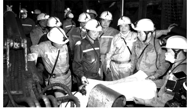
● Chủ tịch HĐTV TKV Lê Minh Chuẩn thăm lực lượng lao động dưới hầm lò.

Những lãnh đạo cao nhất của 2 Tập đoàn cung ứng năng lượng hàng đầu đất nước đều đã có những cuộc động viên, thăm hỏi lực lượng lao động trong đơn vị mình nhân Tháng Công nhân 2022.