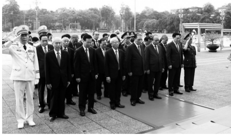
Nguyễn Tổng Bí thư Nông Quốc hội Nguyễn Văn An; các Đứ Mạnh, nguyên Chủ tịch đồng chí Ủy viên Bộ Chính trị, Bí

thư Trung ương Đảng, Phó Chủ tịch nước, Phó Chủ tịch Quốc hội, Phó Thủ tướng Chính phủ cùng nhiều lãnh đạo, nguyên lãnh đạo Đảng, Nhà nước; lãnh đạo các bộ, ban, ngành, đoàn thể Trung ương đã dự lễ viếng.