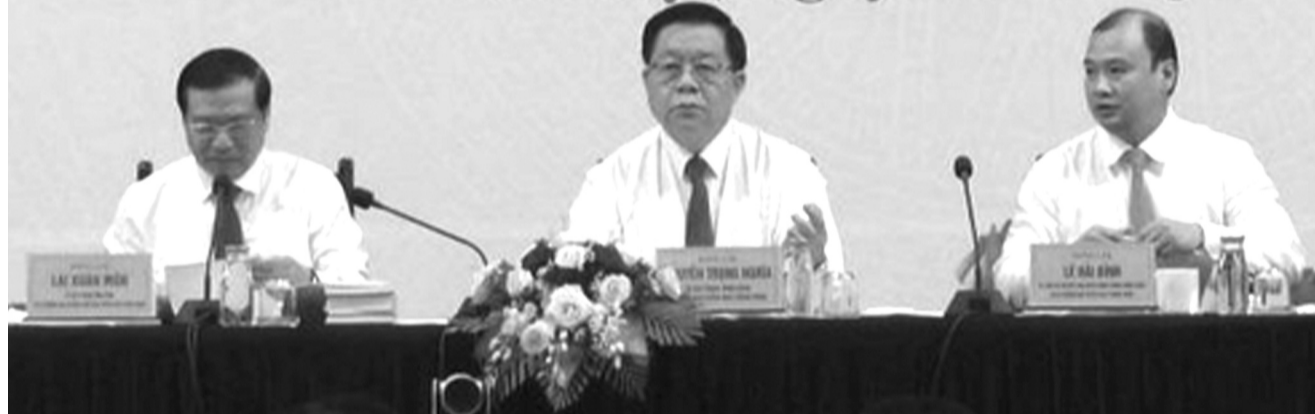
● Trưởng Ban Tuyên giáo Trung ương Nguyễn Trọng Nghĩa chủ trì Hội nghị.

Yêu cầu trên được Bí thư Trung ương Đảng, Trưởng Ban Tuyên giáo Trung ương Nguyễn Trọng Nghĩa nhấn mạnh khi phát biểu chỉ đạo tại Hội nghị giao ban toàn quốc đánh giá 1 năm triển khai thực hiện Nghị quyết số 01/-KL/TW ngày 18/5/2021 của Bộ Chính trị về tiếp tục thực hiện Chỉ thị số 05-CT/TW “Về đẩy mạnh học tập và làm theo tư tưởng, đạo đức, phong cách Hồ Chí Minh”, do Ban Tuyên giáo Trung ương tổ chức chiều qua (19/5).