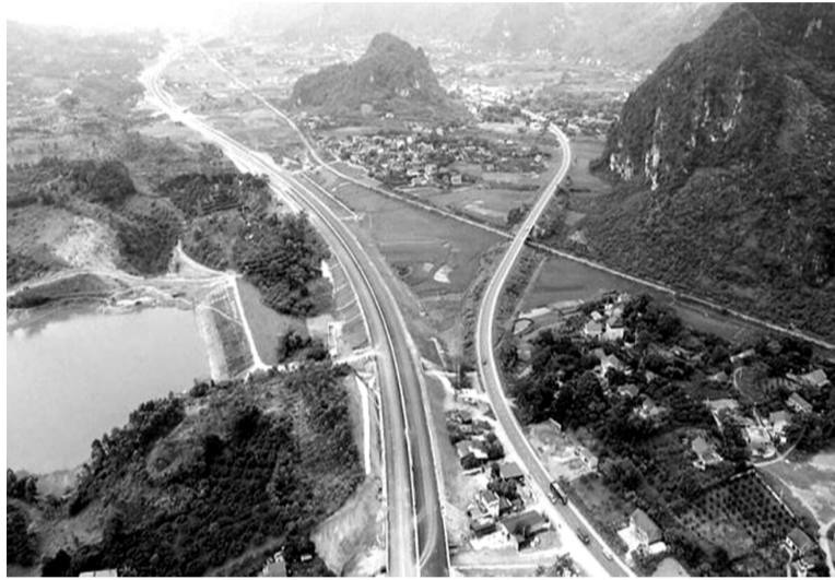
● Hình minh họa.

Góp ý với báo cáo nghiên cứu tiền khả thi dự án đầu tư xây dựng tuyến cao tốc Đồng Đăng - Trà Lĩnh, một số bộ, ngành đề nghị UBND tỉnh Cao Bằng làm rõ vì sao dự án điều chỉnh giảm quy mô đầu tư tới 71km, tăng 1.580 tỷ đồng phần vốn góp của Nhà nước; nhưng thời gian hoàn vốn thu phí vẫn đề xuất tăng thêm 7 năm?