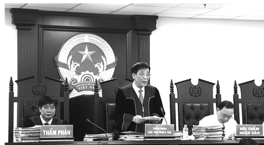
● Chủ tọa tuyên án.