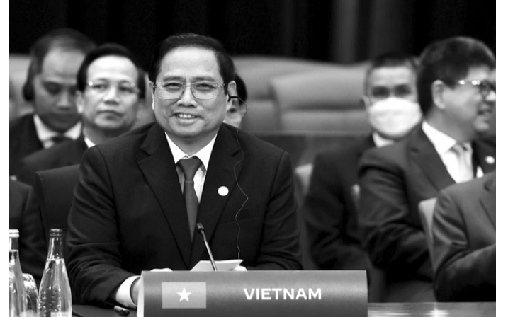
● Thủ tướng Phạm Minh Chính dự Hội nghị Cấp cao đặc biệt ASEAN-Hoa Kỳ.

Sáng qua (19/5), Thủ tướng Phạm Minh Chính và Đoàn đại biểu cấp cao Việt Nam đã về tới Hà Nội, kết thúc tốt đẹp chuyến công tác tham dự Hội nghị Cấp cao đặc biệt ASEAN – Mỹ, thăm và làm việc tại Mỹ và Liên Hợp quốc (LHQ) từ ngày 11/5 đến ngày 17/5.