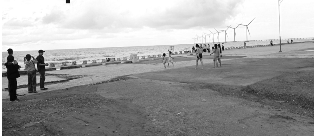
● Dự án điện gió đi vào hoạt động đã tạo điểm nhấn thu hút nhiều lượt khách đến Trà Vinh tham quan, du lịch.

Trà Vinh còn có lợi thế và tiềm năng rất lớn cho phát triển năng lượng tái tạo, đặc biệt là điện gió. Năm 2015, Bộ Công Thương đã phê duyệt quy hoạch phát triển điện gió tỉnh Trà Vinh giai đoạn đến năm 2020, tầm nhìn đến năm 2030, với tổng công suất điện gió đạt khoảng 1.608MW. Hiện nay, Trà Vinh thu hút 09 dự án điện gió, cấp chủ trương đầu tư cho 08 dự án với tổng công suất là 570MW, tổng vốn đầu tư khoảng 27.336 tỷ đồng, 01 dự án đang hoàn thiện hồ sơ xin cấp chủ trương đầu tư, mức đầu tư khoảng 3.800 tỷ đồng. Năm 2021 có 05 dự án sẽ hòa lưới