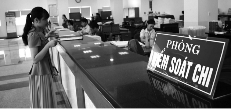
● Mục tiêu đến năm 2025, sẽ không còn giao dịch chi bằng tiền mặt qua hệ thống kho bạc.

Theo Đề án phát triển thanh toán không dùng tiền mặt trong hệ thống Kho bạc Nhà nước, cơ quan này phấn đấu đến cuối năm 2025 không còn giao dịch chi bằng tiền mặt và giảm đến mức tối thiểu các giao dịch thu bằng tiền mặt.