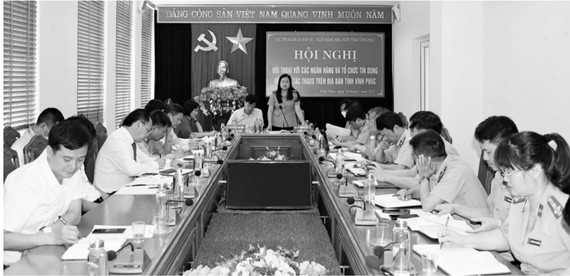
● Cục THADS Vinh Phúc đối thoại với các ngân hàng, tổ chức tín dụng trên địa bàn.

Mới đây, Cục Thi hành án dân sự Vinh Phúc phối hợp với Ngân hàng Nhà nước Chi nhánh Vinh Phúc tổ chức Hội nghị đối thoại với các ngân hàng và tổ chức tín dụng trên địa bàn tỉnh về công tác thi hành án dân sự, nhằm thống nhất trong công tác phối hợp, giải quyết dứt điểm các vụ việc đang có khó khăn, vướng mắc.