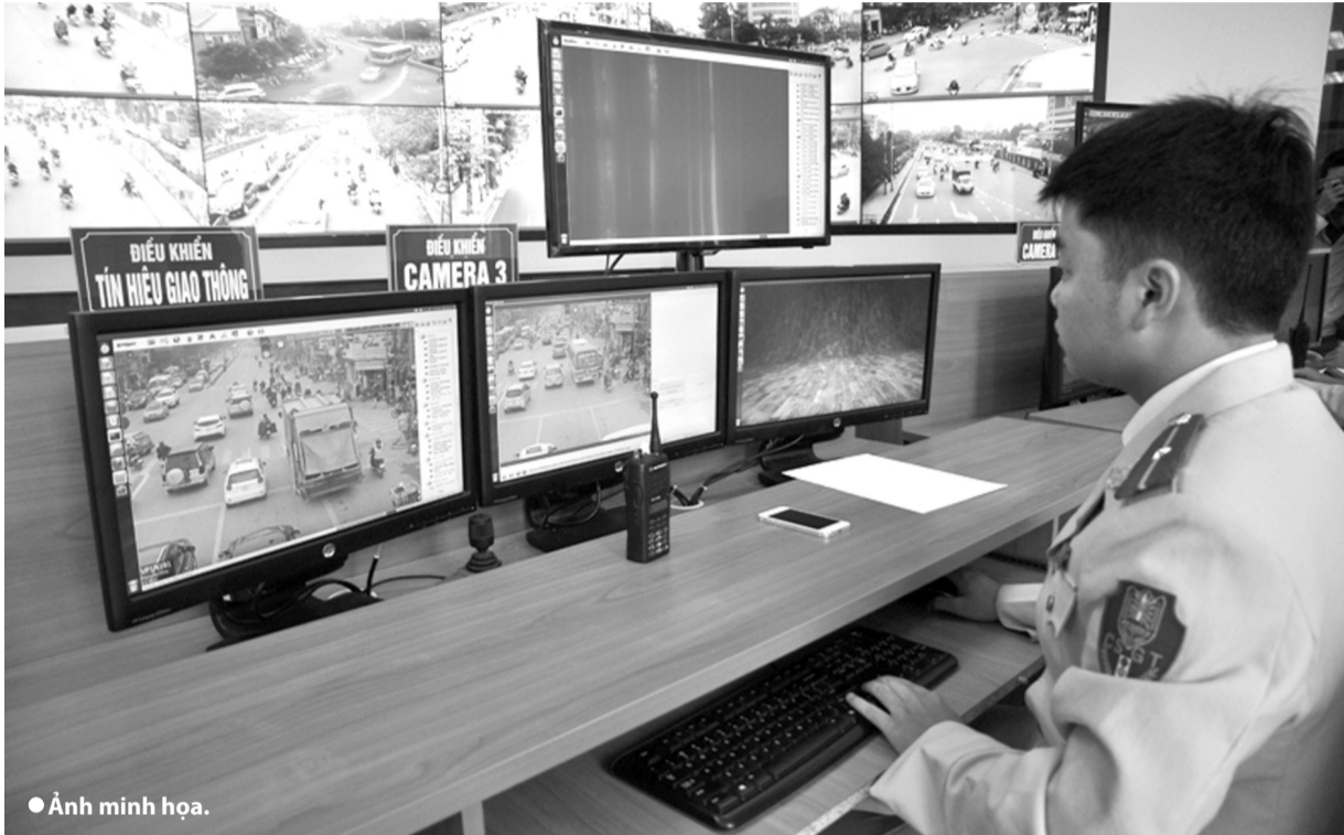
● Ảnh minh họa.