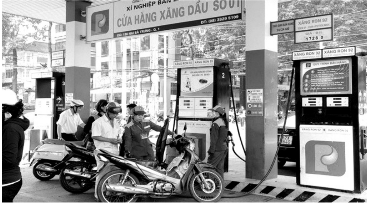
● Mỗi lít xăng đến tay người tiêu dùng đang phải chịu 38-40% là thuế, phí. (Ảnh minh họa).

Dự báo giá xăng dầu có thể sẽ vượt ngưỡng 30.000 đồng/lit trong kỳ điều hành tới đây (21/5/2022). Việc đề xuất giảm các loại thuế phí đã được đưa ra nhiều lần. Đây gần như được coi là phương án duy nhất để giảm áp lực tăng của xăng dầu ở thị trường trong nước.