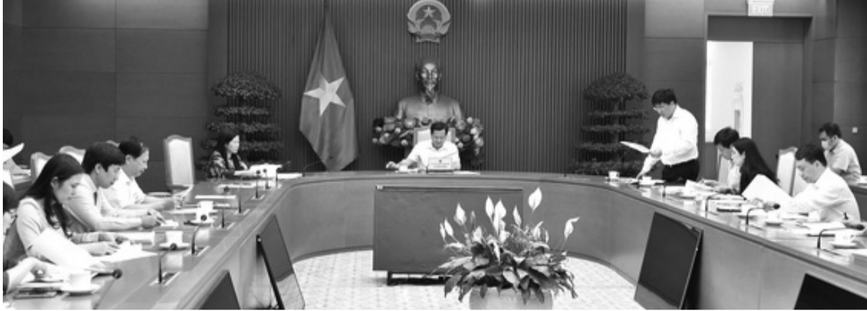
● Quang cảnh cuộc họp.

Phó Thủ tướng Chính phủ Lê Minh Khái, Tổ trưởng Tổ công tác số 2 của Thủ tướng Chính phủ nhấn mạnh yêu cầu trên tại cuộc họp sáng qua (19/5) với 8 bộ, cơ quan trung ương nhằm kiểm tra, đôn đốc giải ngân vốn đầu tư công năm 2022.