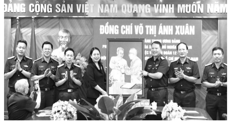
● Phó Chủ tịch nước Võ Thị Ánh Xuân tặng quà lưu niệm cho Binh đoàn 12/Tổng Công ty Xây dựng Trường Sơn.

Nhân kỷ niệm 63 năm Ngày mở đường Hồ Chí Minh - Ngày truyền thống Bộ đội Trường Sơn (19/5/1959 - 19/5/2022), Phó Chủ tịch nước Võ Thị Ánh Xuân đã đến thăm, làm việc với Binh đoàn 12 và Hội truyền thống Trường Sơn.