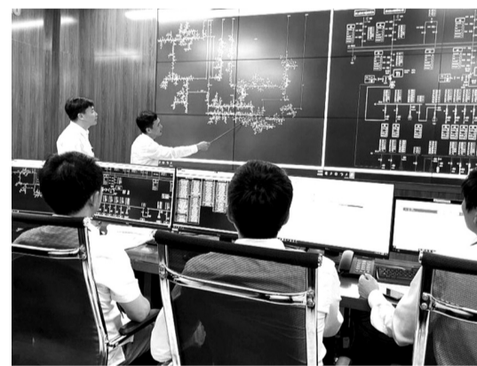
● Kiểm tra tín hiệu mạch vòng trung áp tại Trung tâm điều khiển xa của PC Lai Châu.

Được biết, Dự án Tự động hóa lưới điện trung áp năm 2022 được Tổng Công ty Điện lực miền Bắc giao cho PC Lai Châu thực hiện từ tháng 12/2021, với quy mô xây dựng 4 mạch vòng lưới điện thông minh DMS trên lưới