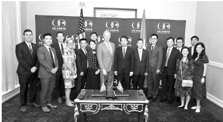
● Đại diện hai đơn vị tại Lễ ký kết.